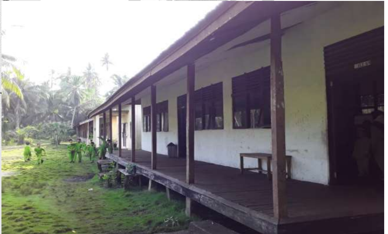
Sekolah SD Negeri 016 Batang Tumu Kecamatan Mandah