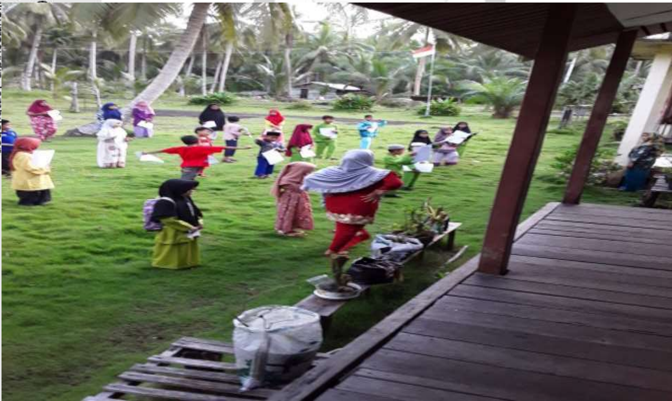
Gedung Sekolah SD Negeri 016 Batang Tumu Kecamatan Mandah