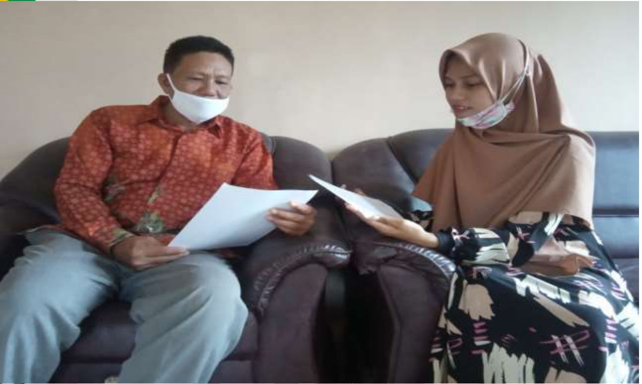
Saat Melakukan Wawancara