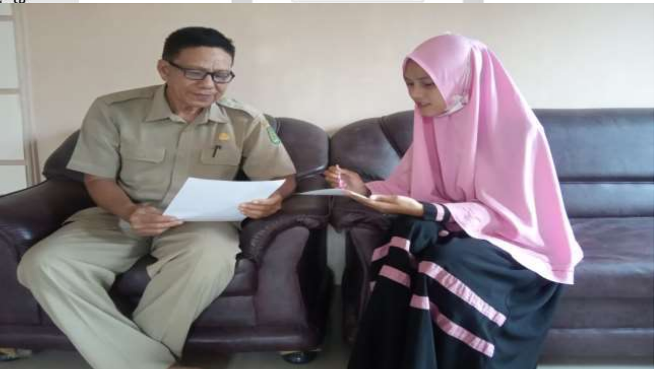
Saat Melakukan Wawancara