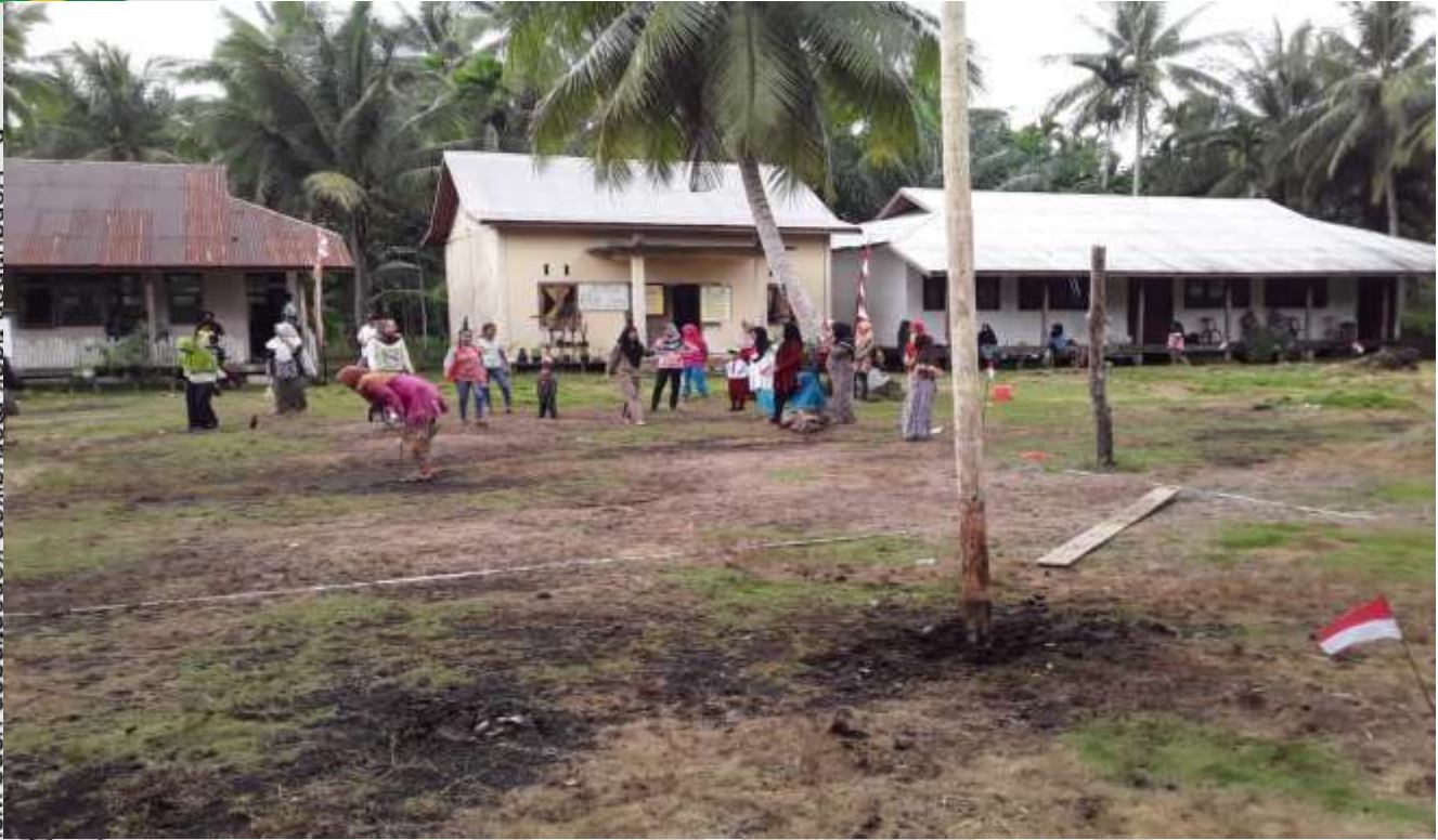
Sekolah SD Negeri 016 Batang Tumu Kecamatan Mandah

2. Dilarang mengemukakan dan memperbanyak sebagian atau seluruh karya tulis ini dalam bentuk apapun tanpa seijin STAI Aulaurasyidin Temblahan