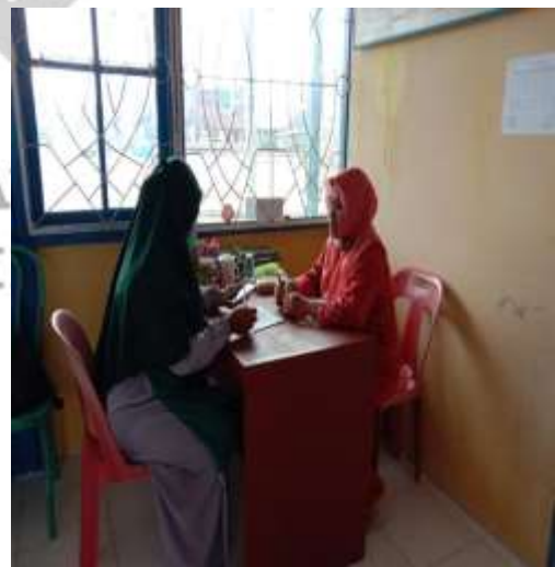
Penulis sedang melakukan wawancara kepada salah satu guru PAI