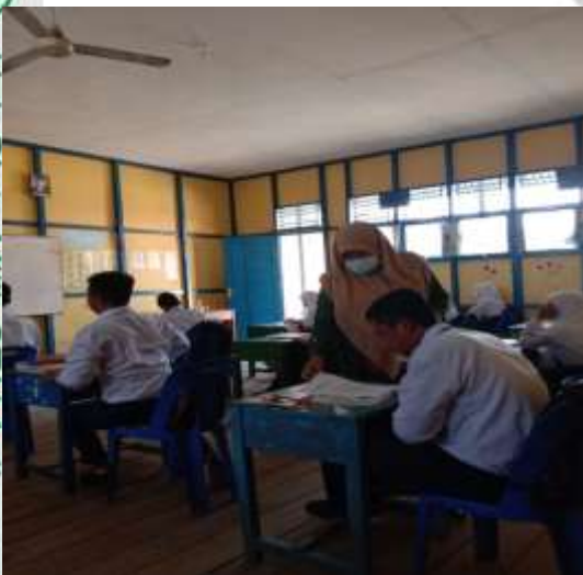
Penulis sedang menyebarkan angket kepada siswa/I