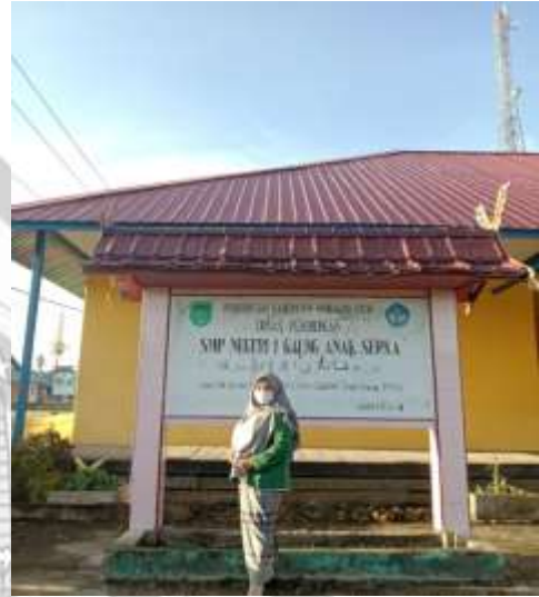
Penulis sedang berada di lokasi penelitian