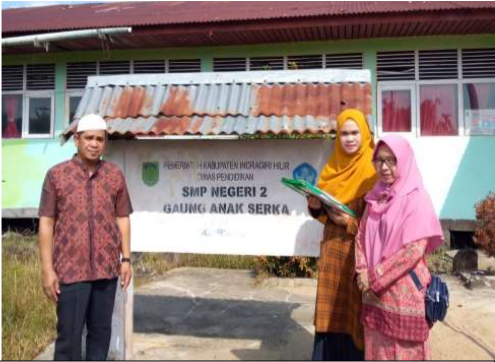
Photo Dokumentasi Papan Nama Atau Plank SMPN 02 Gaung Anak Serka.