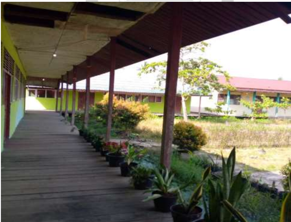
Photo Dokumentasi Bangunan Sekolah/Lokal SMPN 02 Gaung Anak Serka.