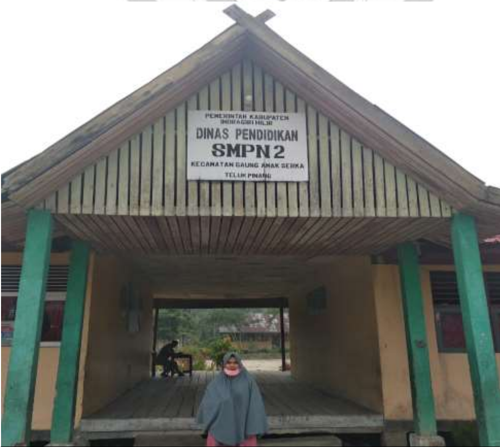
Photo Dokumentasi Gerbang Sekolah SMPN 02 Gaung Anak Serka.