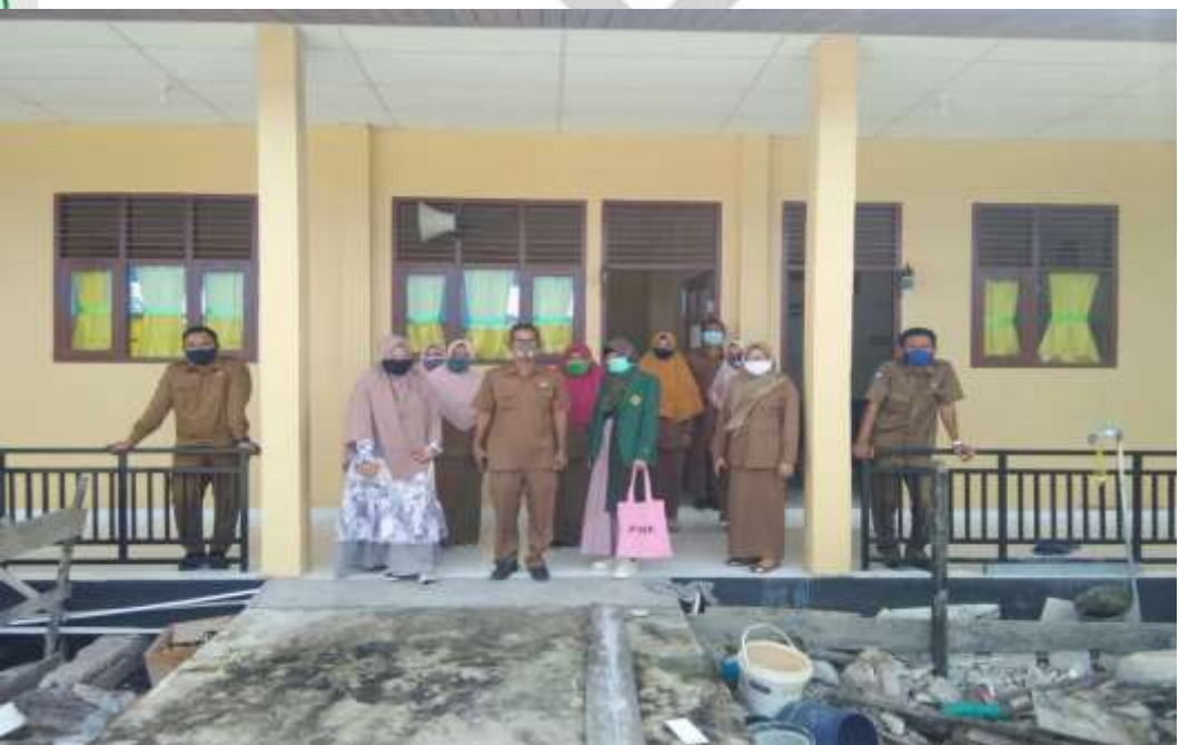
PHOTO BERSAMA MAJELIS GURU