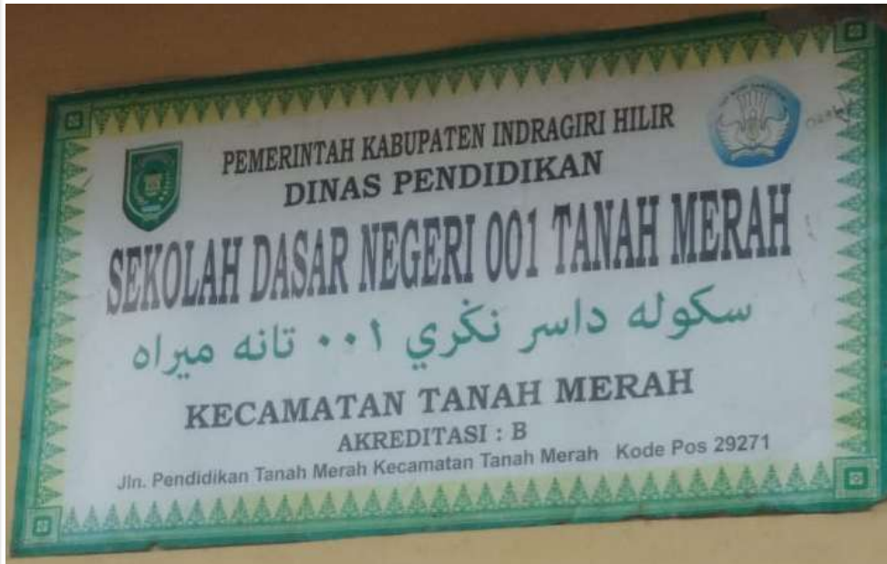
PAPAN NAMA SEKOLAH DASAR NEGERI 001 KECAMATAN TANAH MERAH

IMPLEMENTASI COOPERATIVE LEARNING BERMUATAN KARAKTER PADA MATA PELAJARAN PENDIDIKAN AGAMA ISLAM KELAS TINGGI DI SEKOLAH DASAR NEGERI 001 KECAMATAN TANAH MERAH