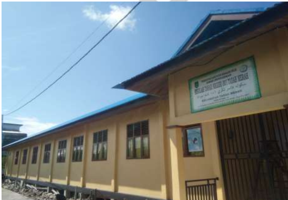
GEDUNG SEKOLAH DASAR NEGERI 001 KECAMATAN TANAH MERAH