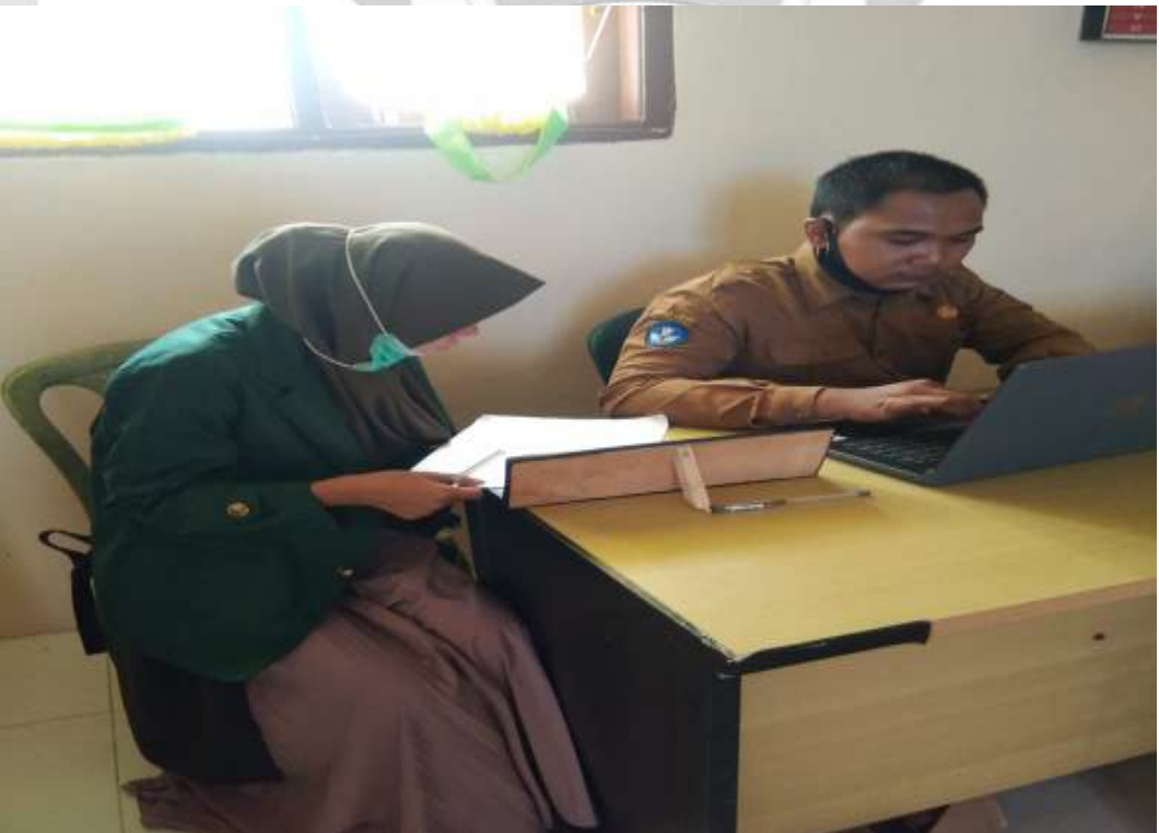
PENELITI SEDANG MELAKUKAN WAWANCARA