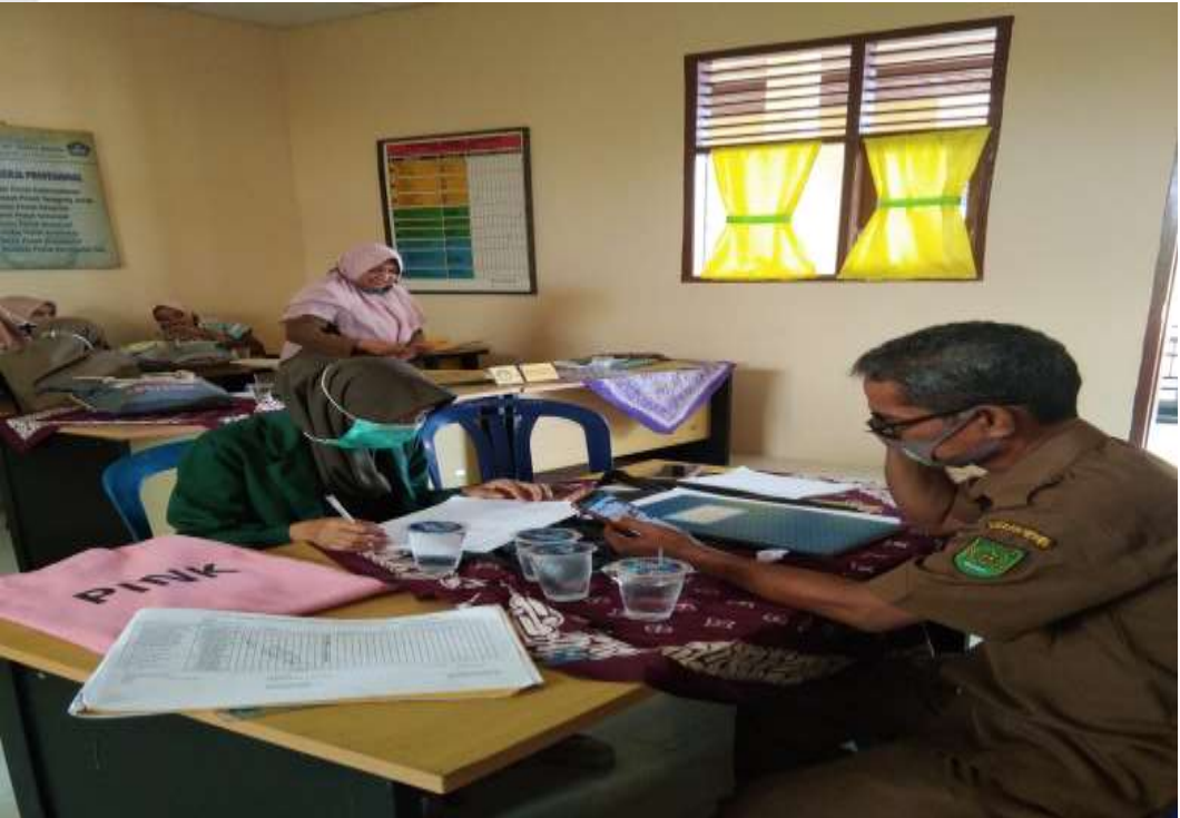
PENELITI MELAKUKAN PENGUMPULAN DATA