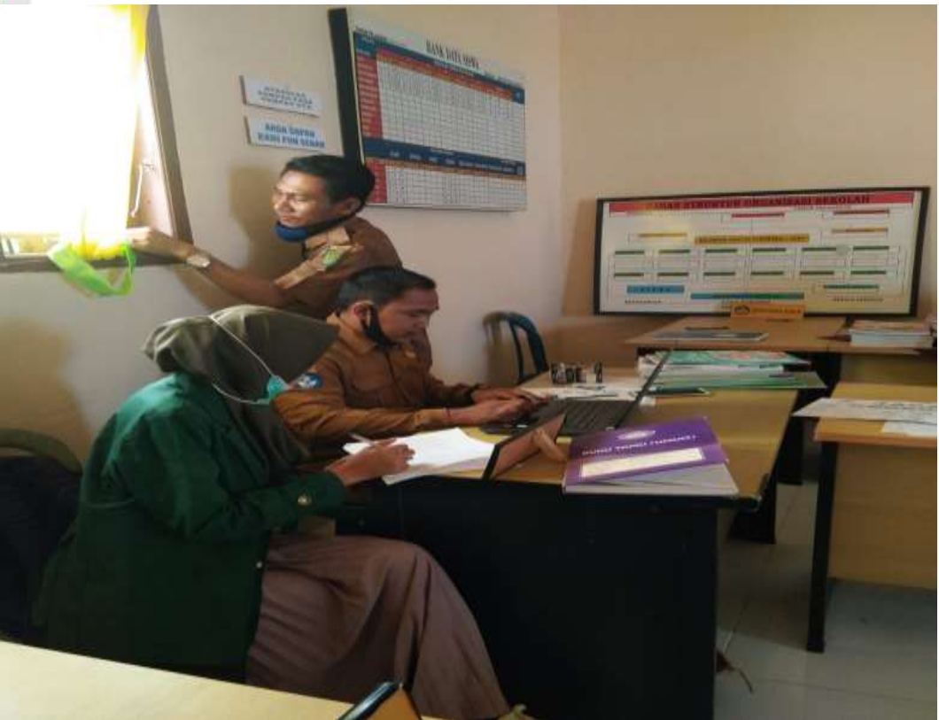
PENELITI SEDANG MENGUMPULKAN DATA PROFIL SEKOLAH