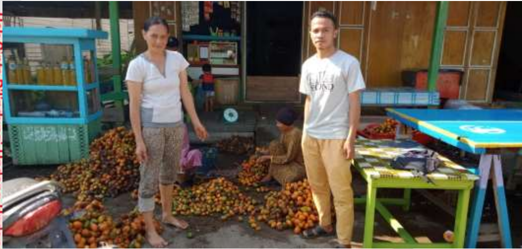
Gambar 5 : Wawancara Dengan Informan