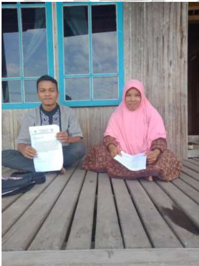
Gambar 6 : Wawancara Dengan Informan

© Hak Cipta Milik STAI Auliaurasyidin Tembilahan