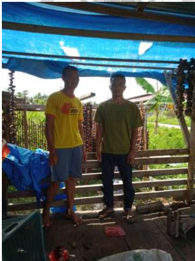
Gambar 2 : Wawancara Dengan Informan