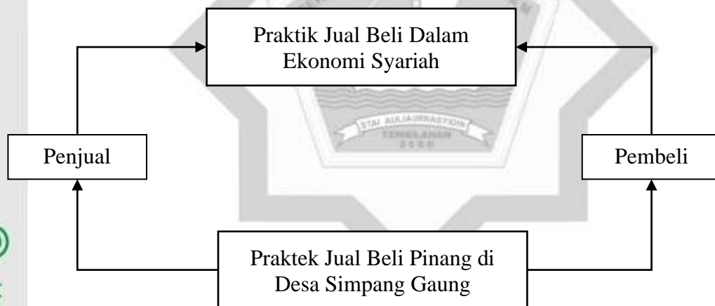
Gambar 2.1 Kerangka Bepikir

Untuk mengetahui masalah yang akan dibahas, maka perlu adanya kerangka berpikir yang merupakan landasan dalam meneliti suatu masalah untuk menemukan, mengembangkan dan menguji kebenaran suatu penelitian. Maka kerangka berpikir ini dapat digambarkan ini sebagai berikut: