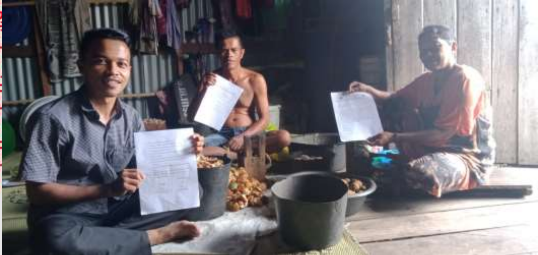
Gambar 1 : Wawancara Dengan Informan