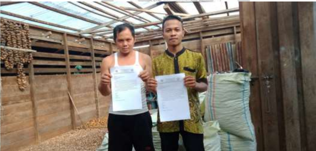
Gambar 4 : Wawancara Dengan Informan