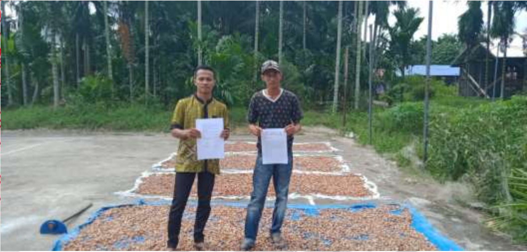
Gambar 3 : Wawancara Dengan Informan