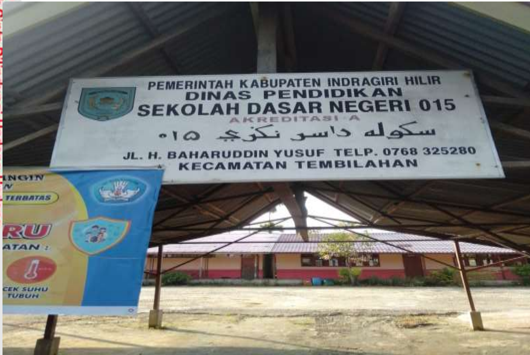
Plang Sekolah Dasar Negeri 015 Tembilahan