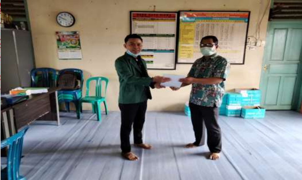
PENELITI MENYERAHKAN SURAT IZIN RISET