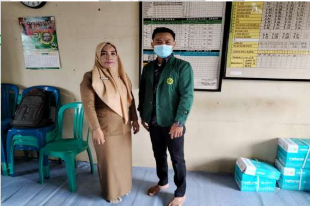
PENELITI BERSAMA GURU