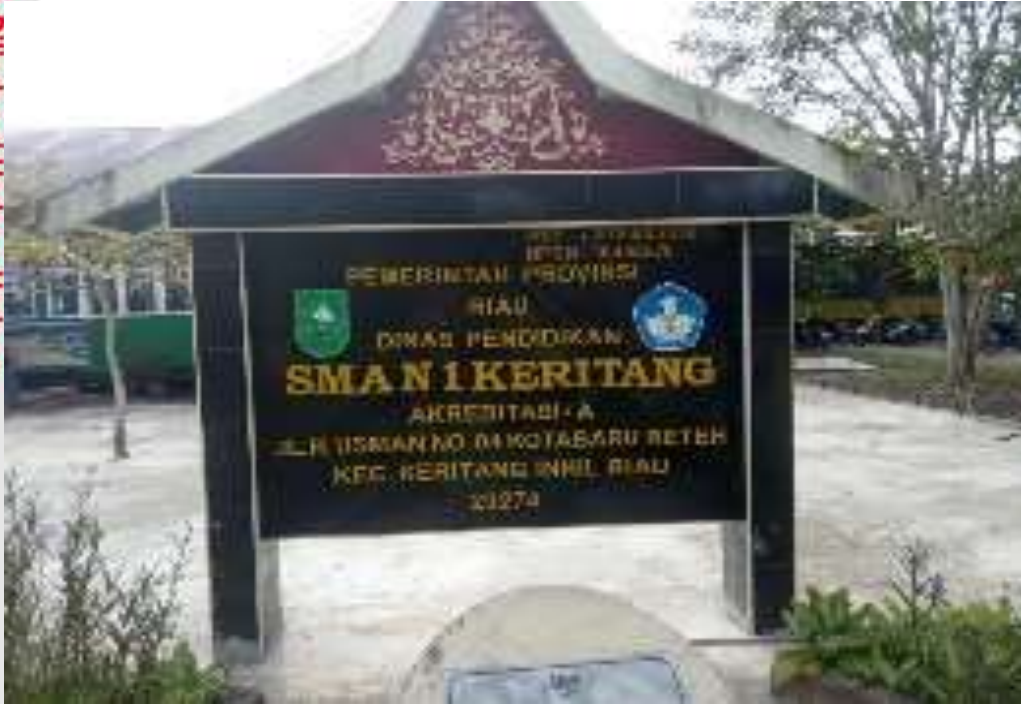
PAPAN NAMA SEKOLAH MENENGAH ATAS NGERI 1 KERITANG KECAMATAN KERITANG

Hak Cipta Milik STAI Auliaurasyidin Tembilahan