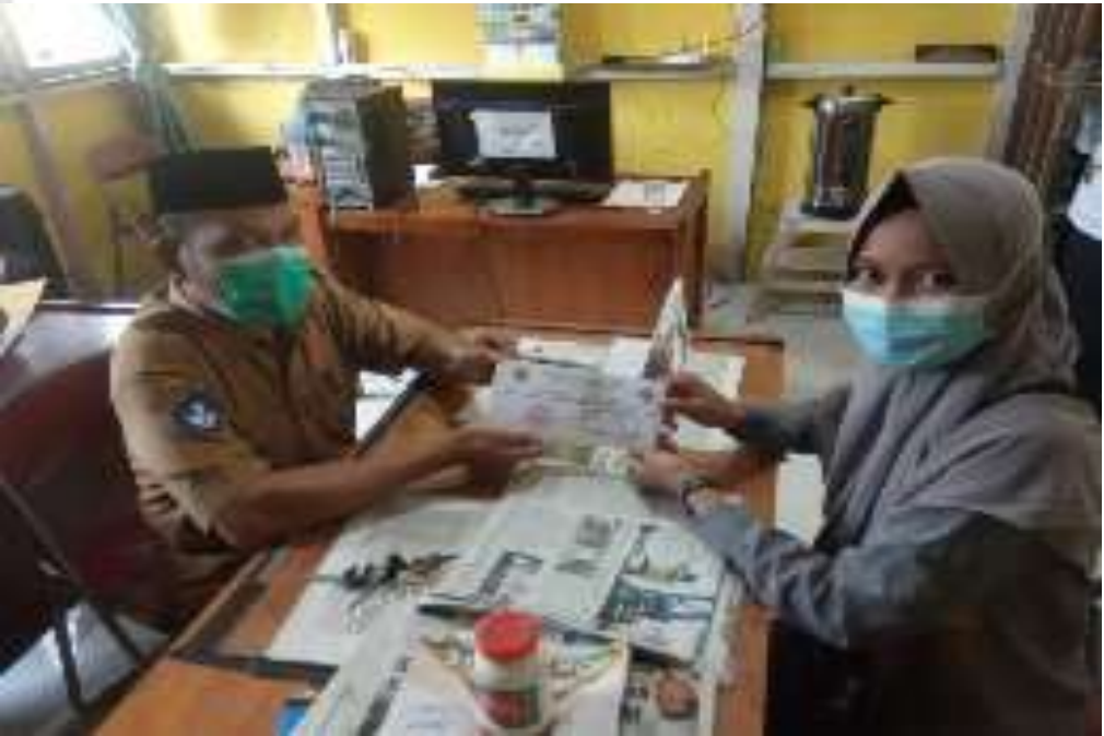
PENYERAHAN SURAT RISET