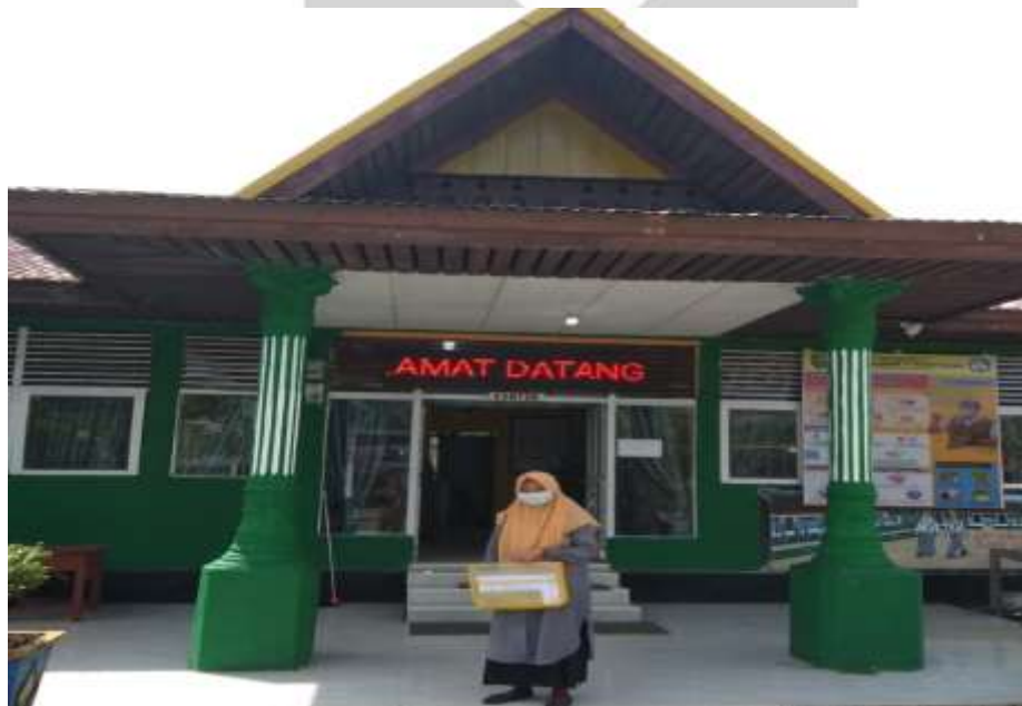
GEDUNG SEKOLAH MENENGAH ATAS NGERI 1 KERITANG KECAMATAN KERITANG

Hak Cipta Milik STAI Auliaurasyidin Tembilahan