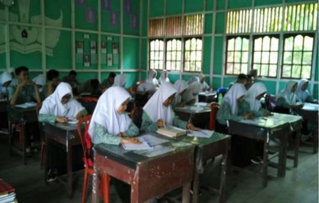
KEGIATAN PEMBELAJARAN MEMBACA KONSEP