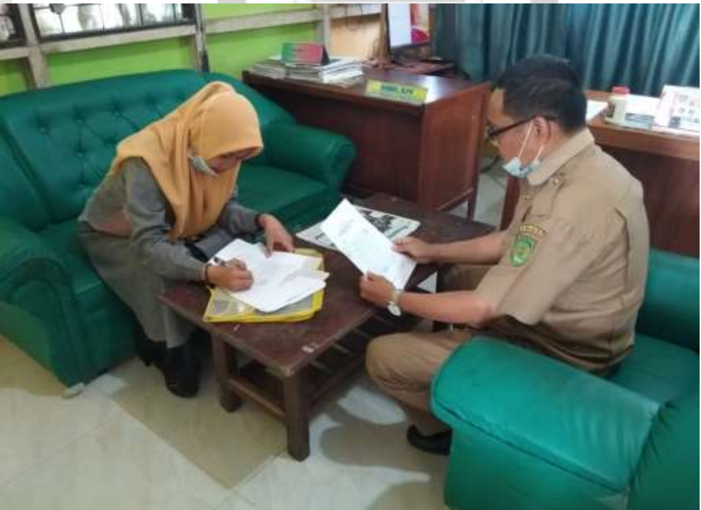
PENELITI MELAKUKAN WAWANCARA