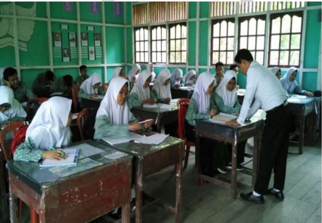
MENJELASKAN MATERI POKOK OLEH SISWA SEBAGAI LATIHAN KOMUNIKASI DALAM PEMBELAJARAN

© Hak Cipta Milik STAI Auliaurrasyidin Tembilahan