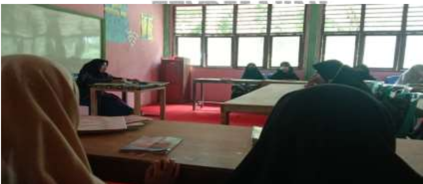
Dokumentasi Observasi Keempat