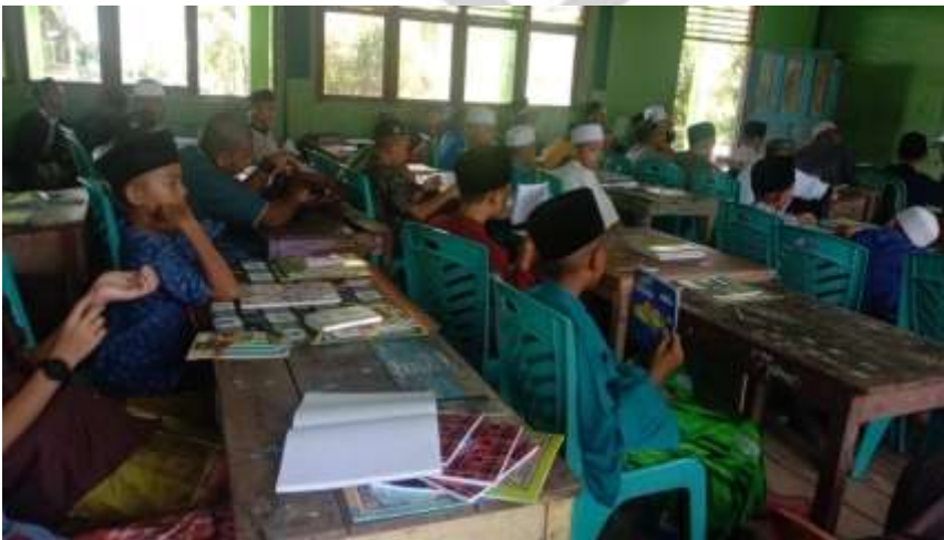
Dokumentasi Pelaksanaan Observasi Pertama