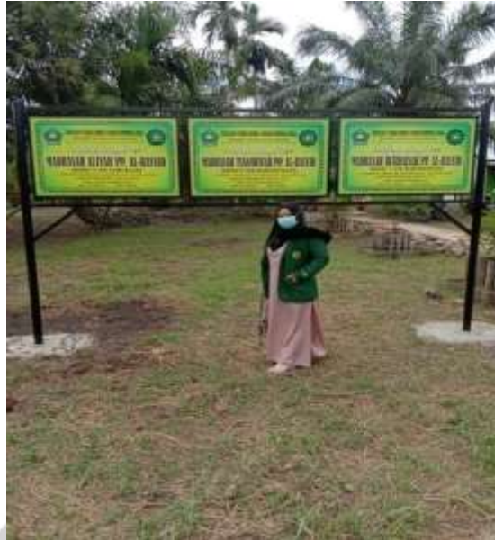
Papan Nama MTs PP Al-Rasyid Simpang Tiga Desa Simpang Jaya Kecamatan Batang Tuaka 07 Juni 2021