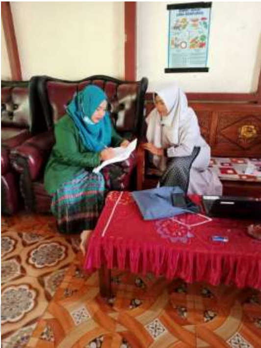
Peneliti Meminta Izin untuk melakukan Observasi dengan Guru Mata Pelajaran Al-Qur'an Hadis