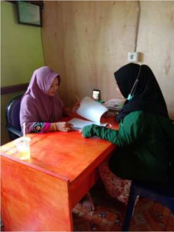
Peneliti Menyerahkan Surat Izin Riset Kepada Kepala Sekolah MTs PP Al-Rasyid Simpang Tiga Desa Simpang Jaya Kecamatan Batang Tuaka