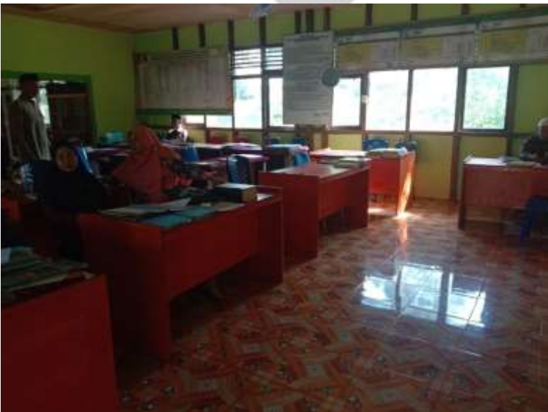
Ruang Majelis Guru MTs PP Al-Rasyid