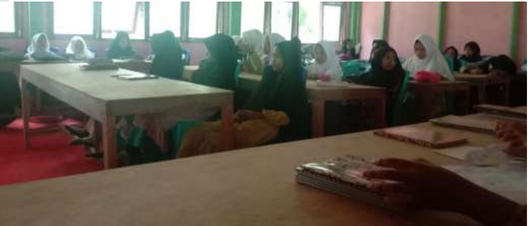
Dokumentasi Observasi Kelima