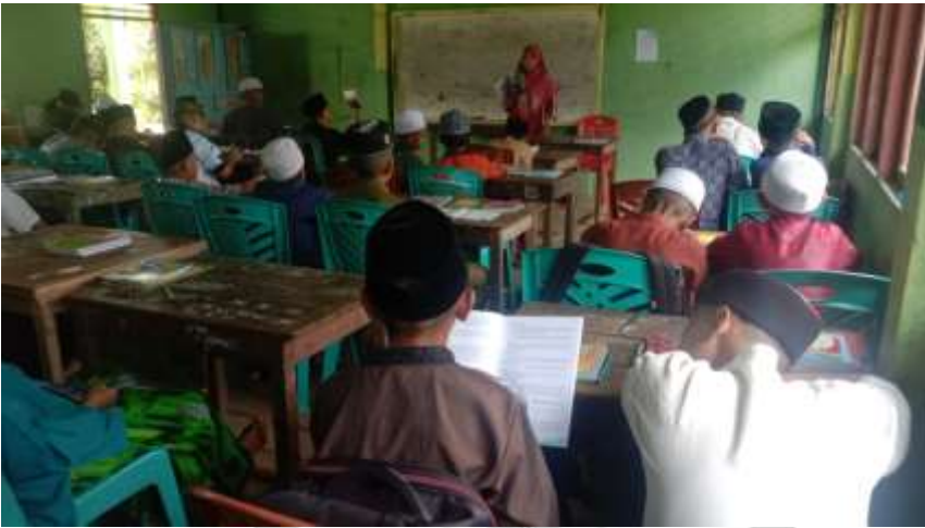
Dokumentasi Observasi Kedua

© Hak Cipta Milik STAL Auliaurrasyidin Tembilahan