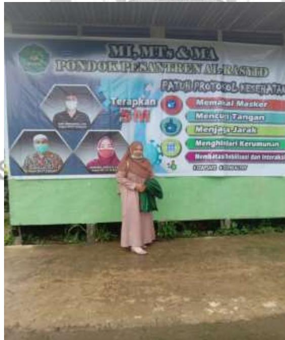
Protokol Kesehatan MTs PP Al-Rasyid Simpang Tiga Desa Simpang Jaya Kecamatan Batang Tuaka