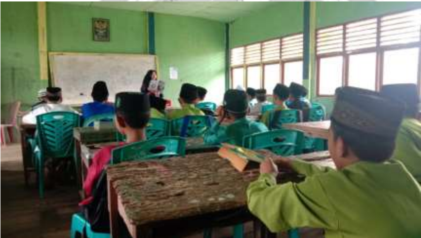
Dokumentasi Observasi Ketiga