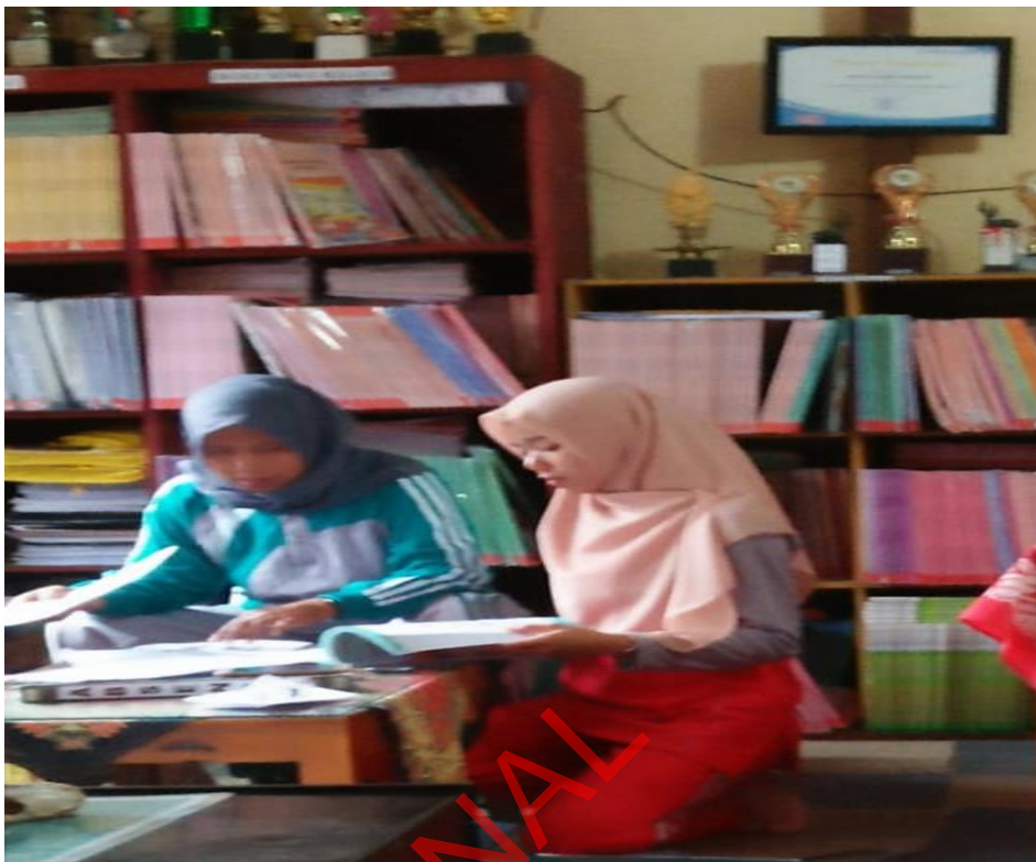
Wawancara dengan Guru Kelas