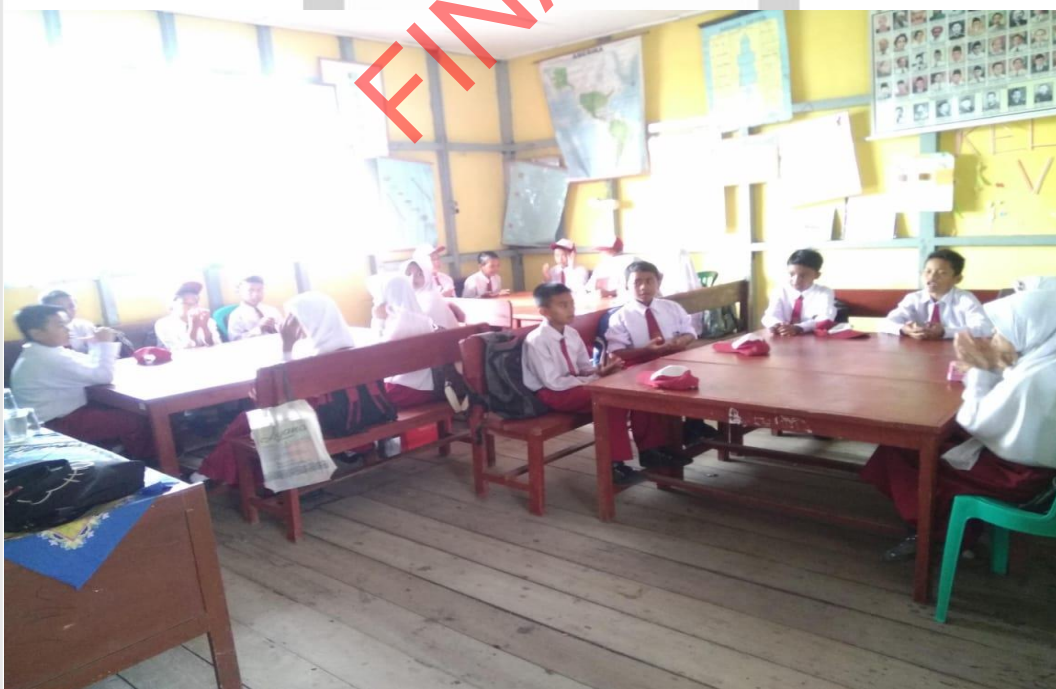
Kegiatan Penentuan Isi Portofolio Dokumentasi