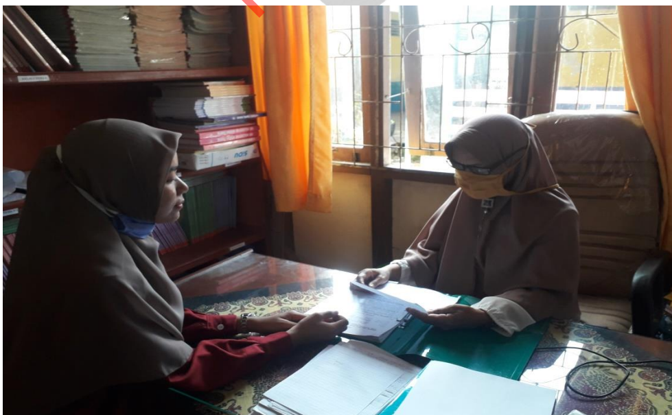
Wawancara dengan Guru Kelas