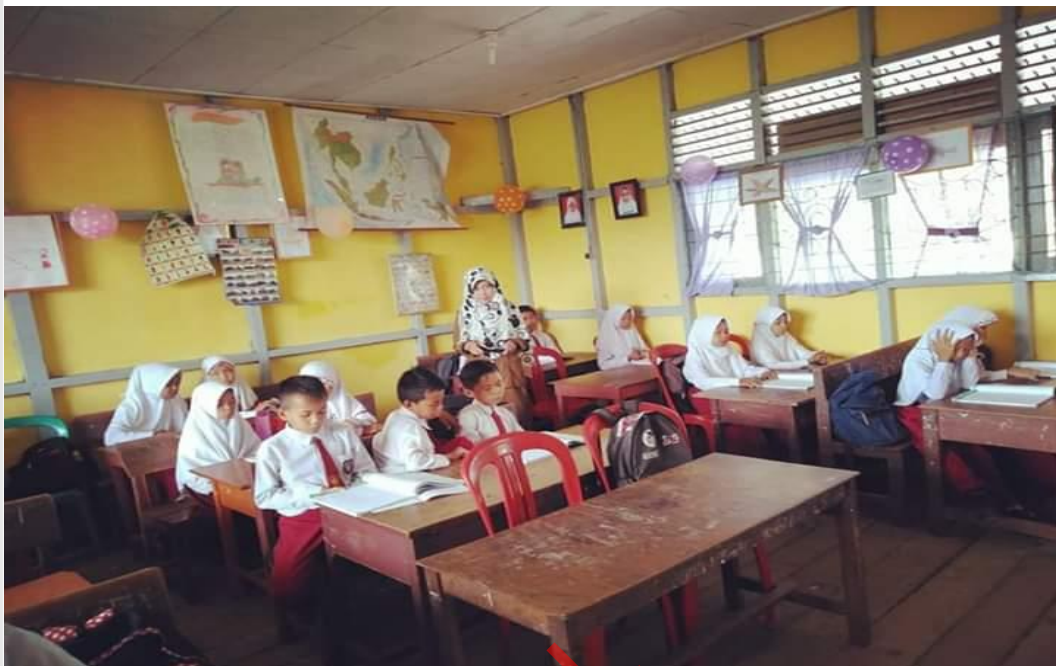
Kegiatan Penentuan Tujuan Portofolio Dokumentasi