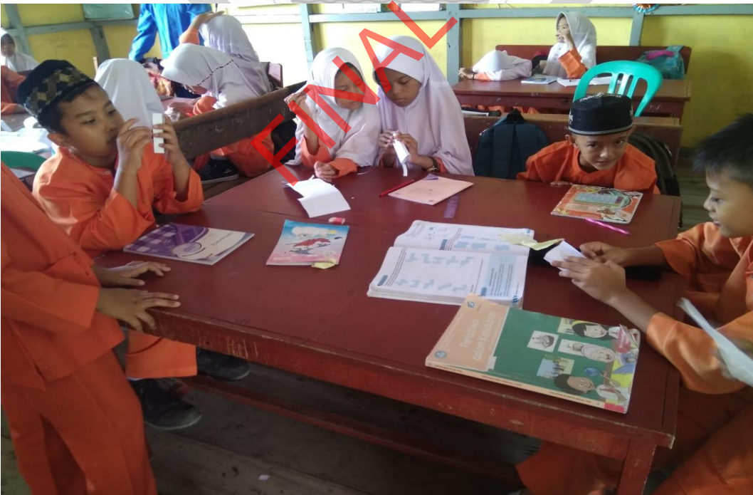
Kegiatan Pengamatan evidence Portofolio Dokumentasi