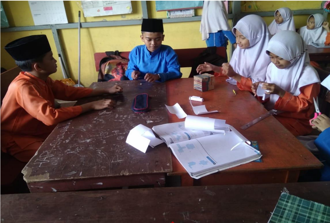
Kegiatan Pengamatan evidence Portofolio Dokumentasi