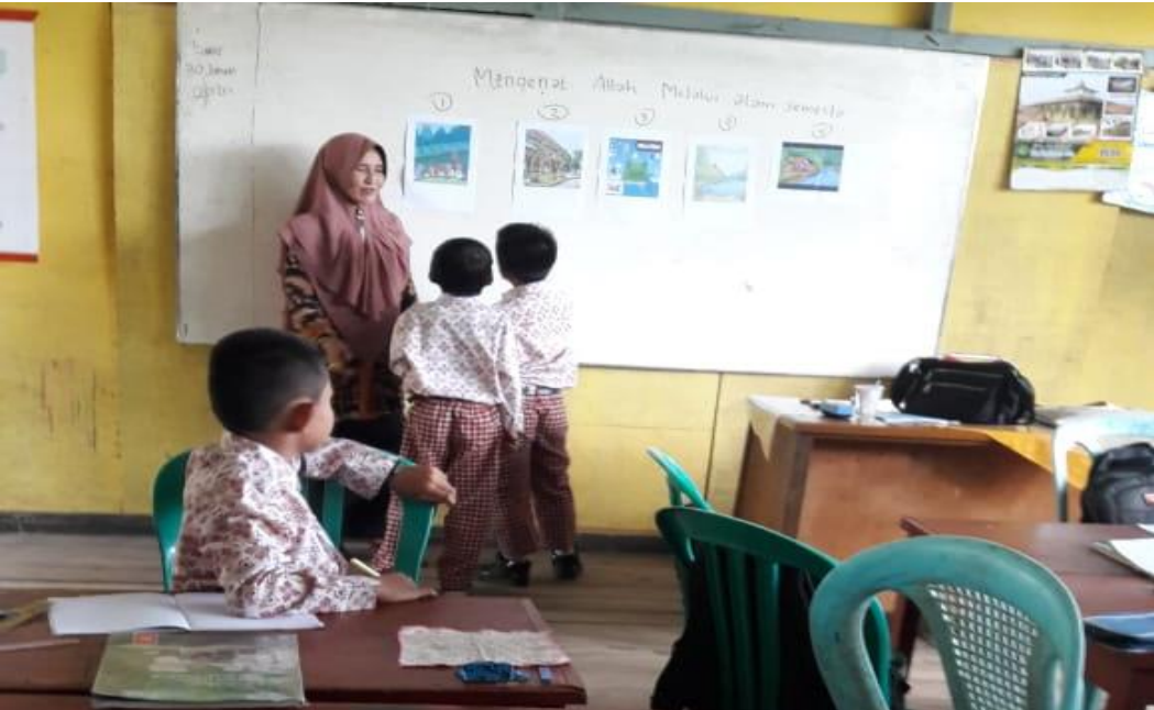
Kegiatan Pengamatan evidence Portofolio Dokumentasi