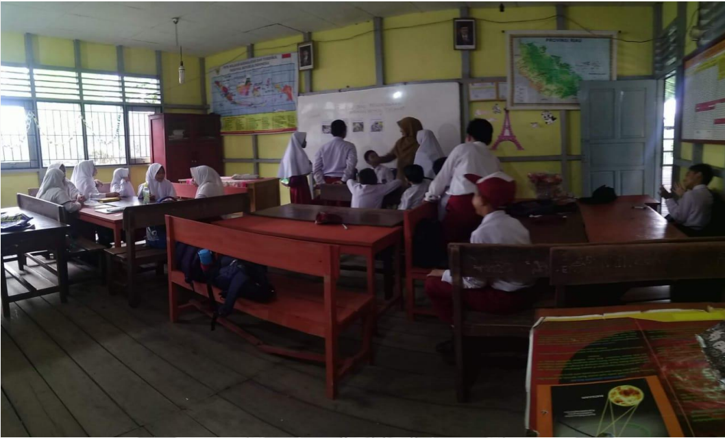
Kegiatan Penentuan Isi Portofolio Dokumentasi