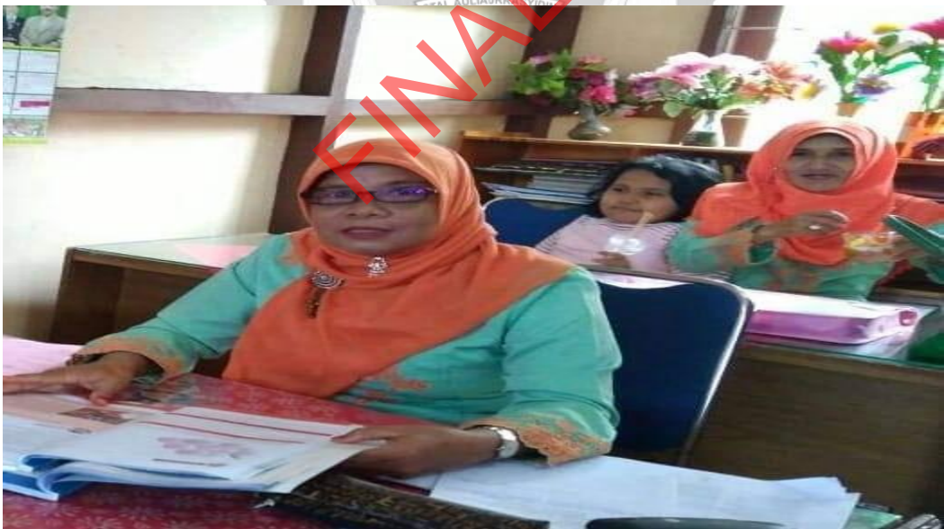
Kegiatan Menyusun Dokumen Portofolio