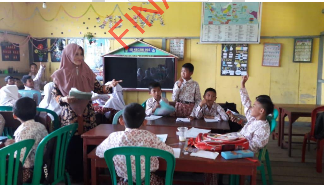
Kegiatan Pengamatan evidence Portofolio Dokumentasi