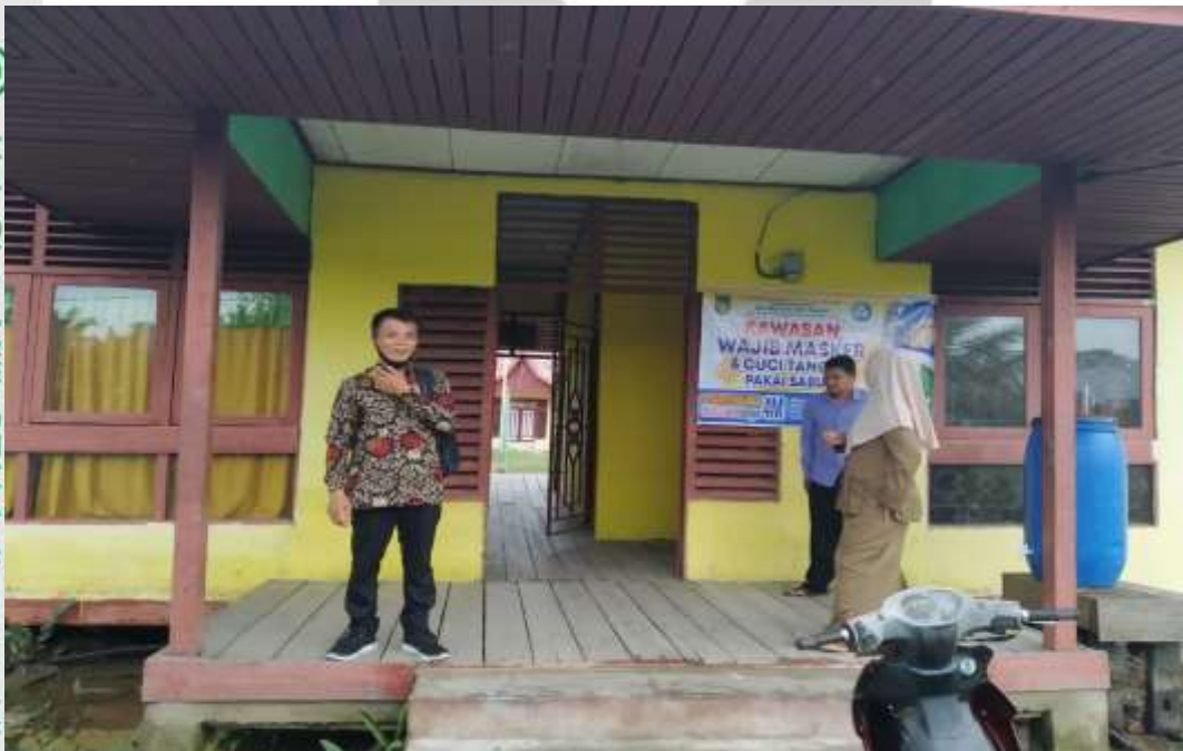
GEDUNG SDN 002 SAPAT

Hak Cipta Milik STAI Auiaurassiyidin Tembilahan