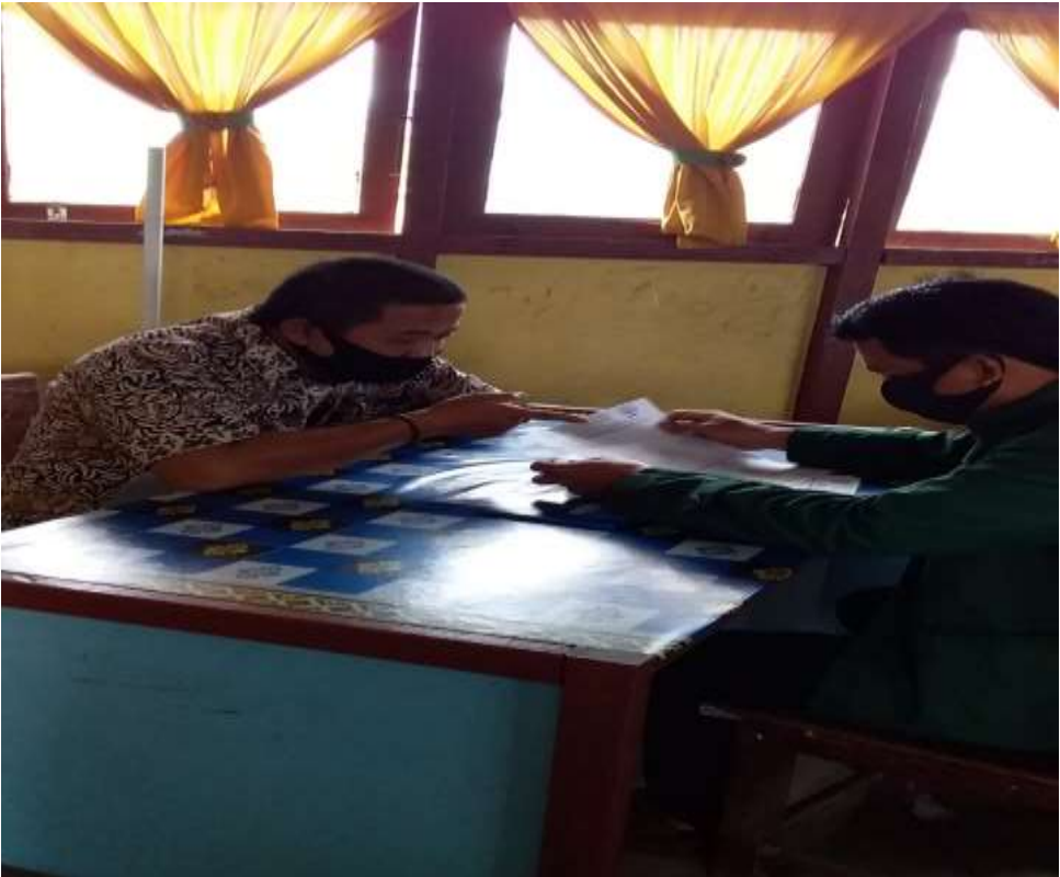
PROSES MENGUPULKAN DATA PROFIL SEKOLAH