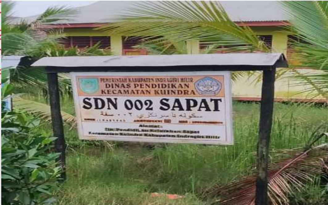
PAPAN NAMA SDN 002 SAPAT