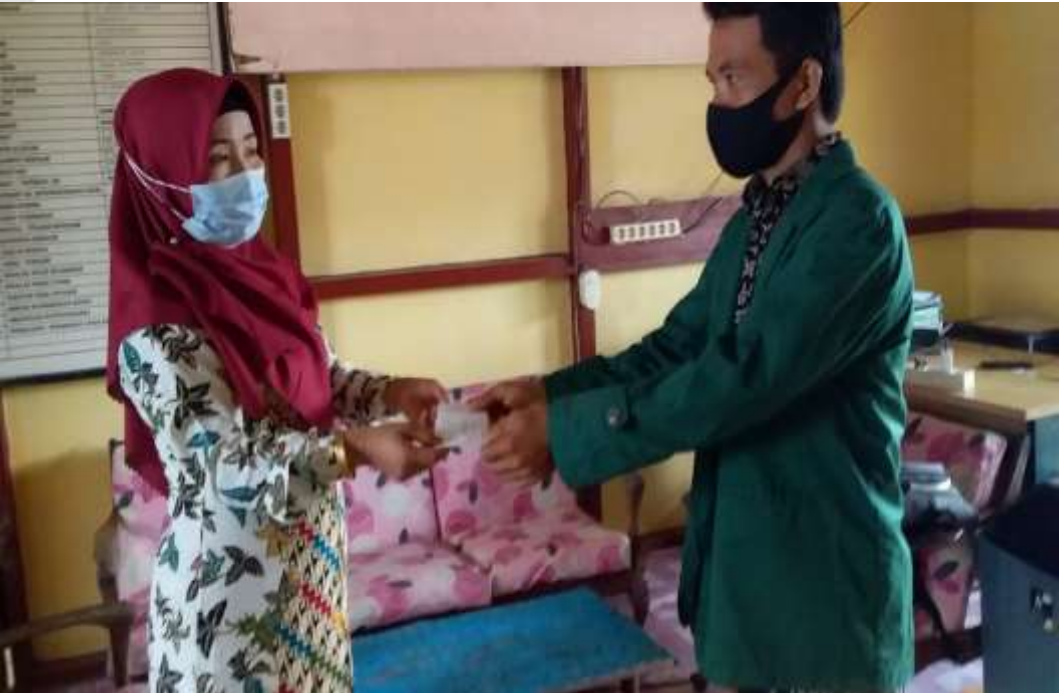
PENYERAHAN SURAT IZIN RISET