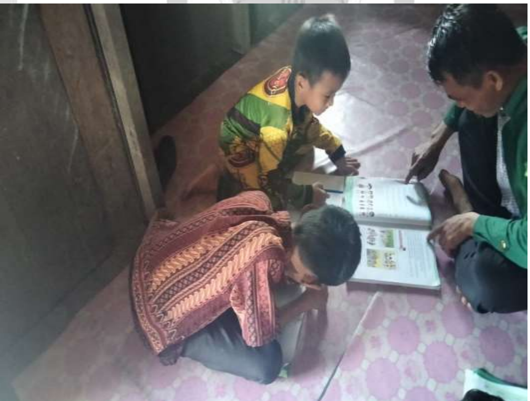
PENELITI SEDANG MENGAMATI KEGIATAN BELAJAR SISWA SECARA DARING