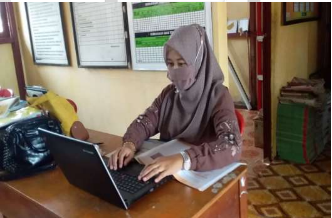
SALAH SEORANG GURU SEDANG MEREKAP NILAI