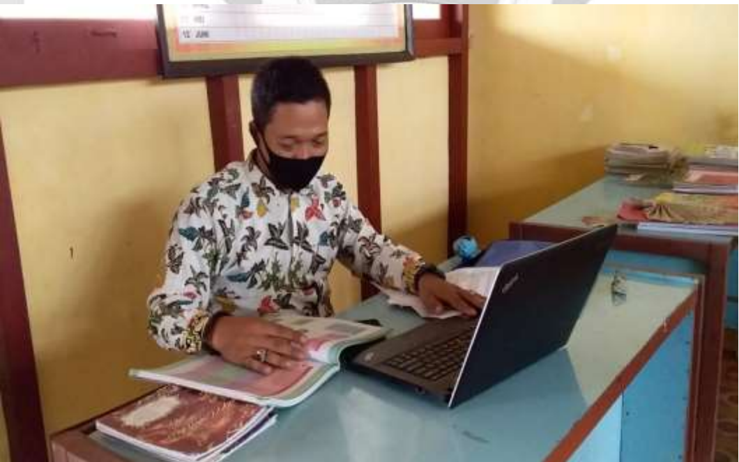
PROSES PENGUMPULAN DATA SEJARAH SEKOLAH