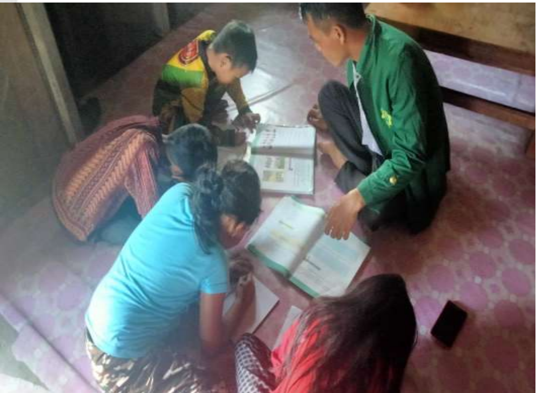
PENELITI SEDANG MENGAMATI KEGIATAN BELAJAR SISWA SECARA DARING