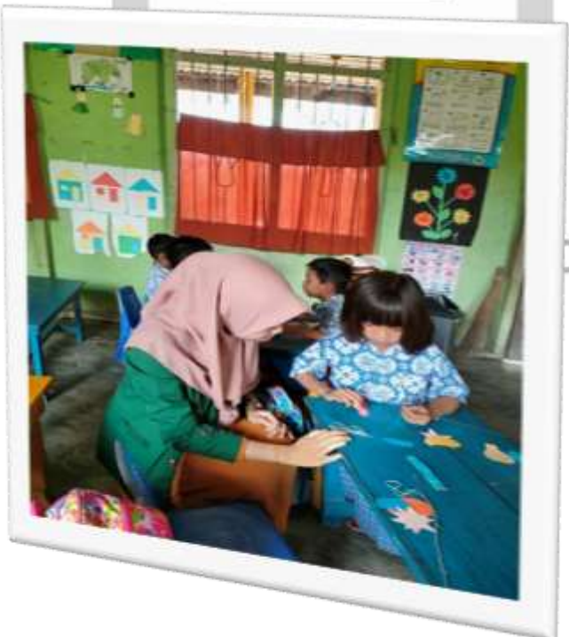
Kegiatan Pretes kreativitas Anak