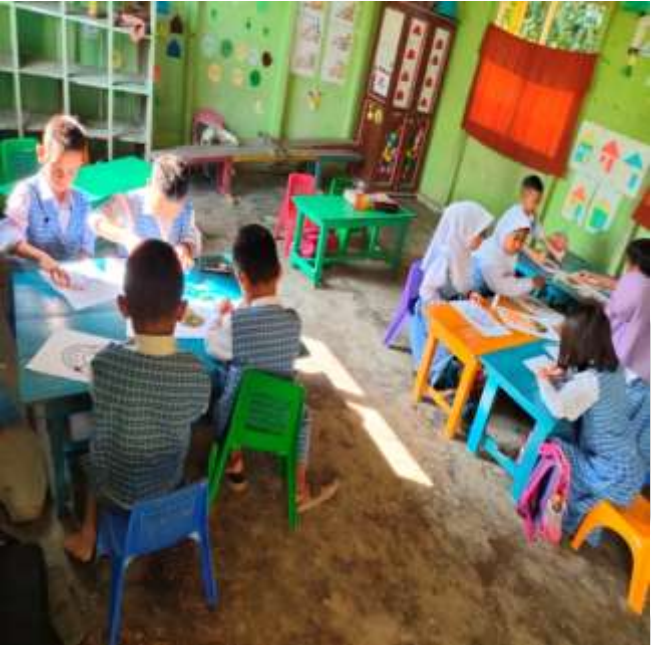
Kegiatan Pretes kreativitas Anak