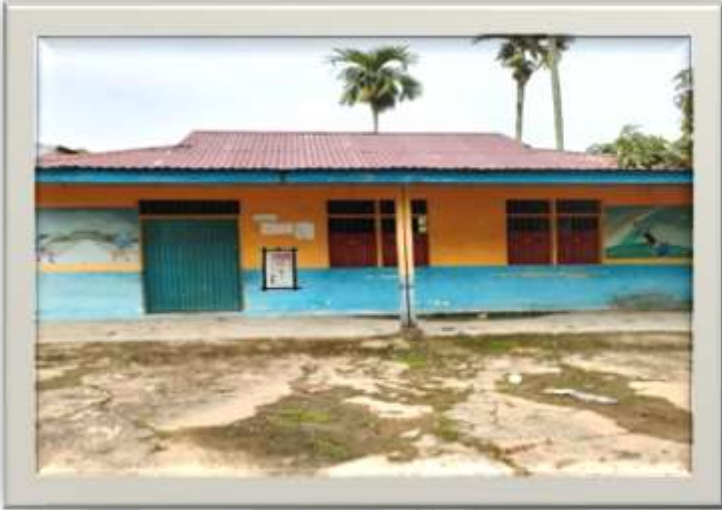
Gedung Raudhatul Athfal At Taqwa Desa Pengalihan Kecamatan Enok