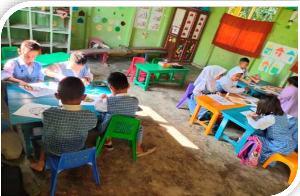
Kegiatan Pembelajaran dengan Metode Proyek