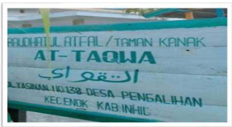
Papan Nama Raudhatul Athfal At Taqwa Desa Pengalihan Kecamatan Enok