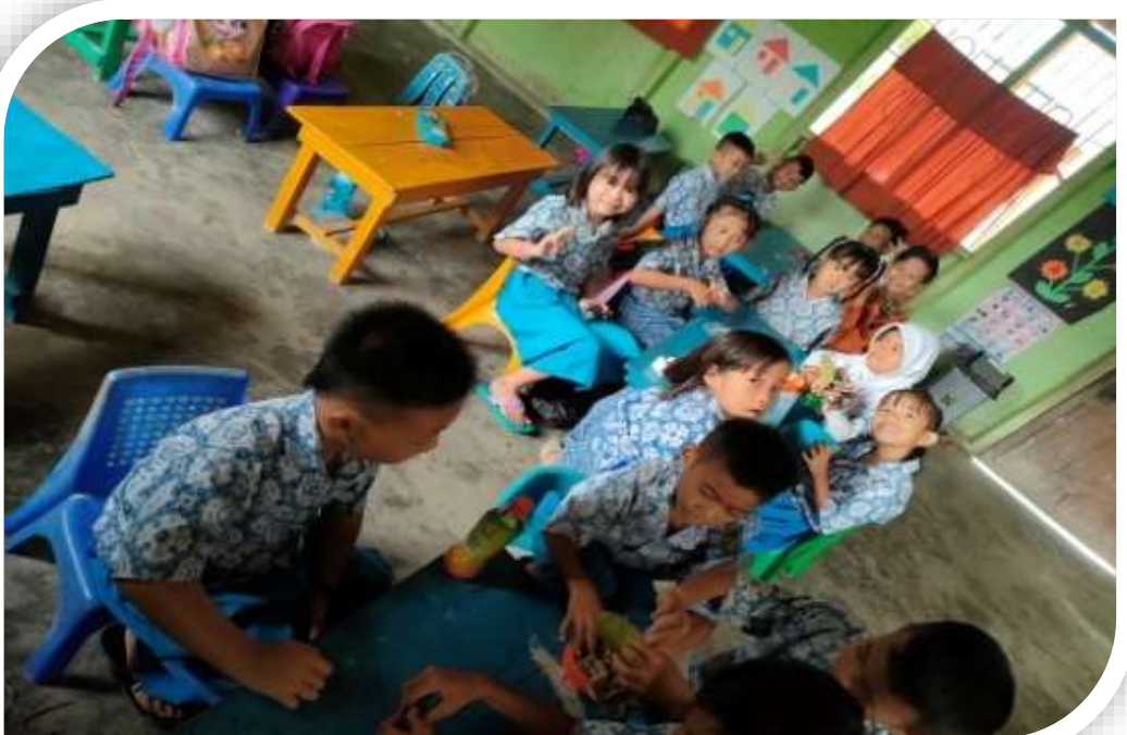
Kegiatan Pembelajaran dengan metode proyek