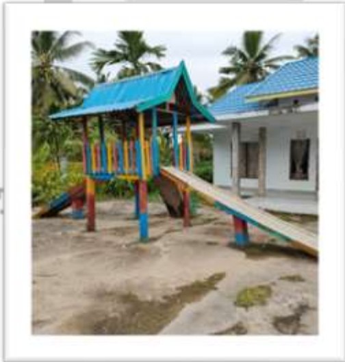
Peralatan Bermain Raudhatul Athfal At Taqwa Desa Pengalihan Kecamatan Enok