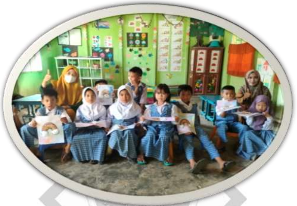
Hasil Karya menempel biji-bijian