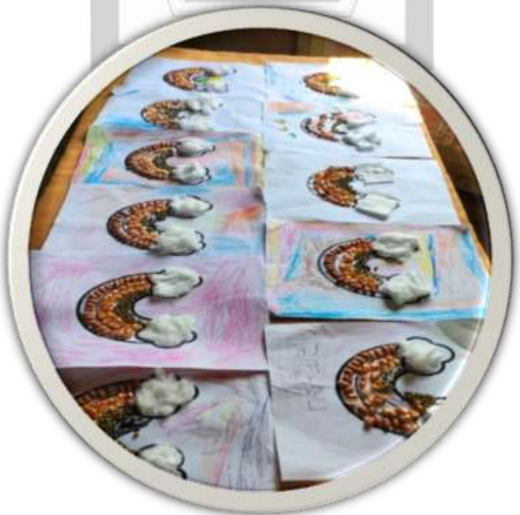
Hasil Karya menepel biji-bijian