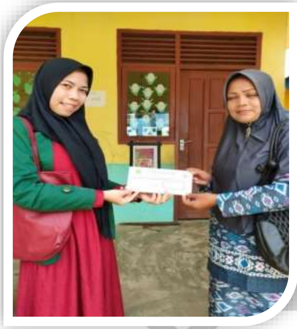
Pengantaran surat riset