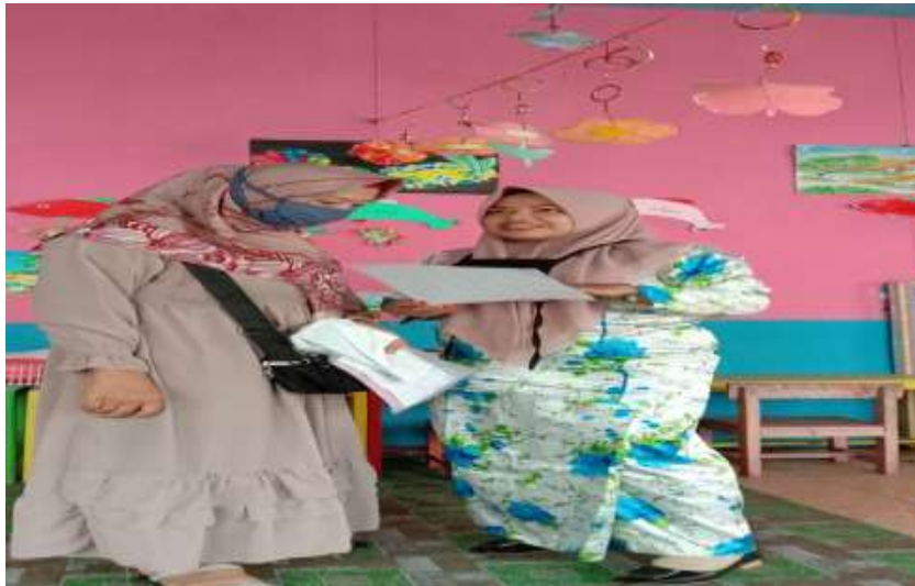
Gambar 7. Proses angket kepada oran tua siswa