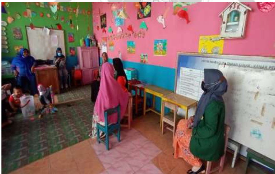
Gambar 12. RUANG KELAS TK PERTIWI II