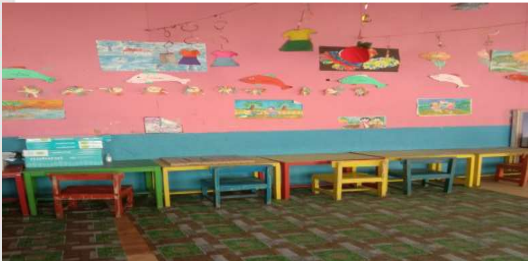
Gambar 11. RUANG KELAS TK PERTIWI II