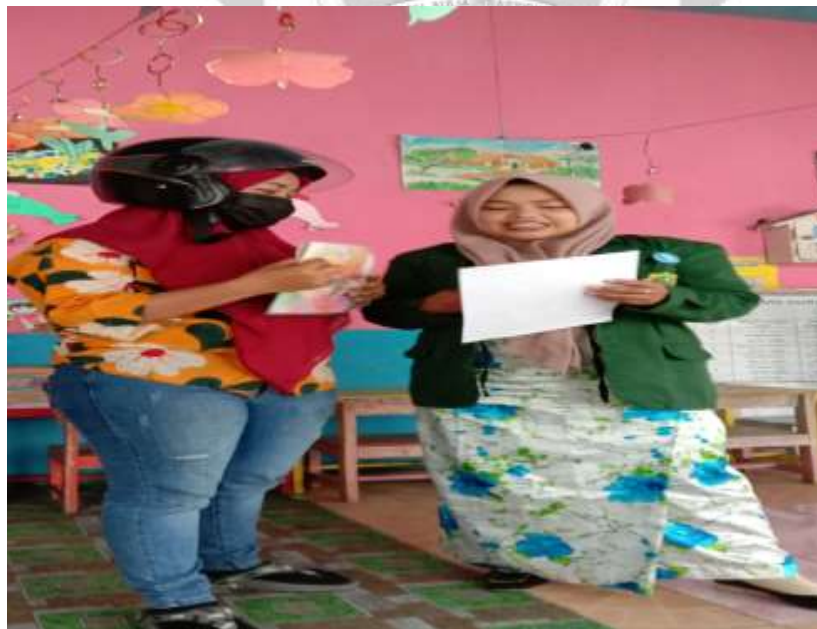
Gambar 8. Proses angket kepada oran tua siswa