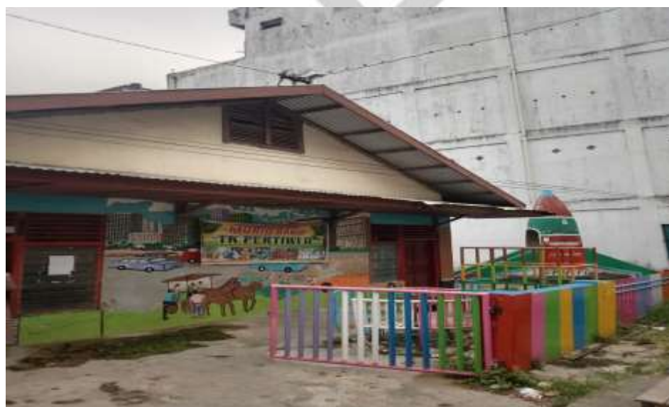
Gambar 10. TK PERTIWI II TEMBILAHAN