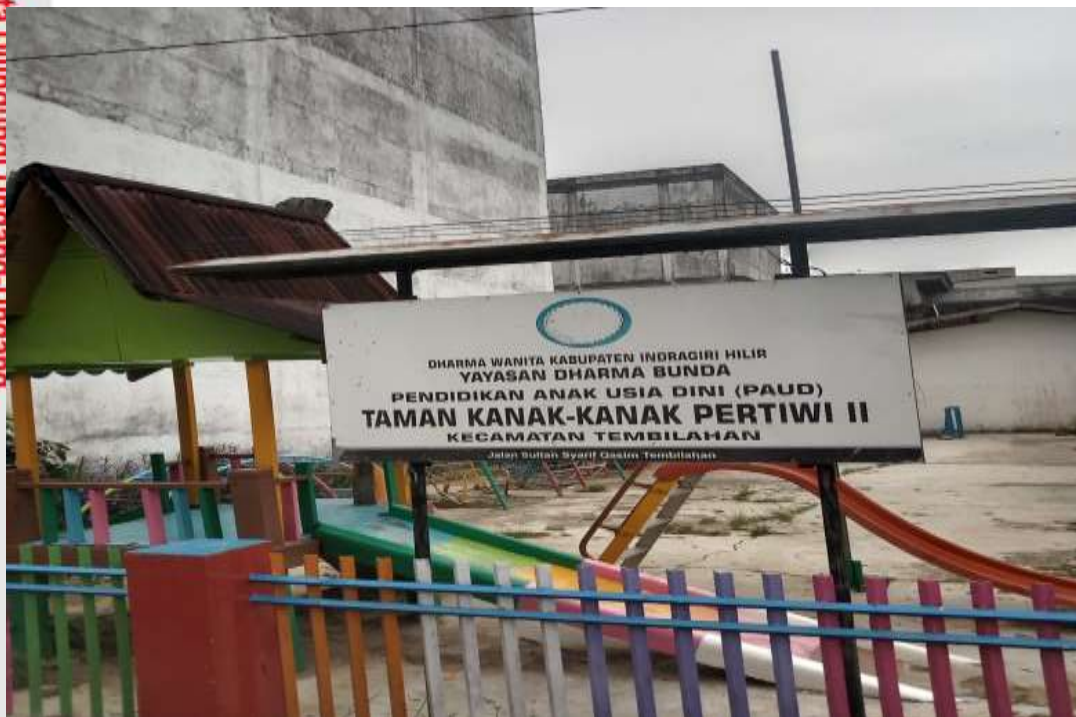
Gambar 9. TK PERTIWI II TEMBILAHAN