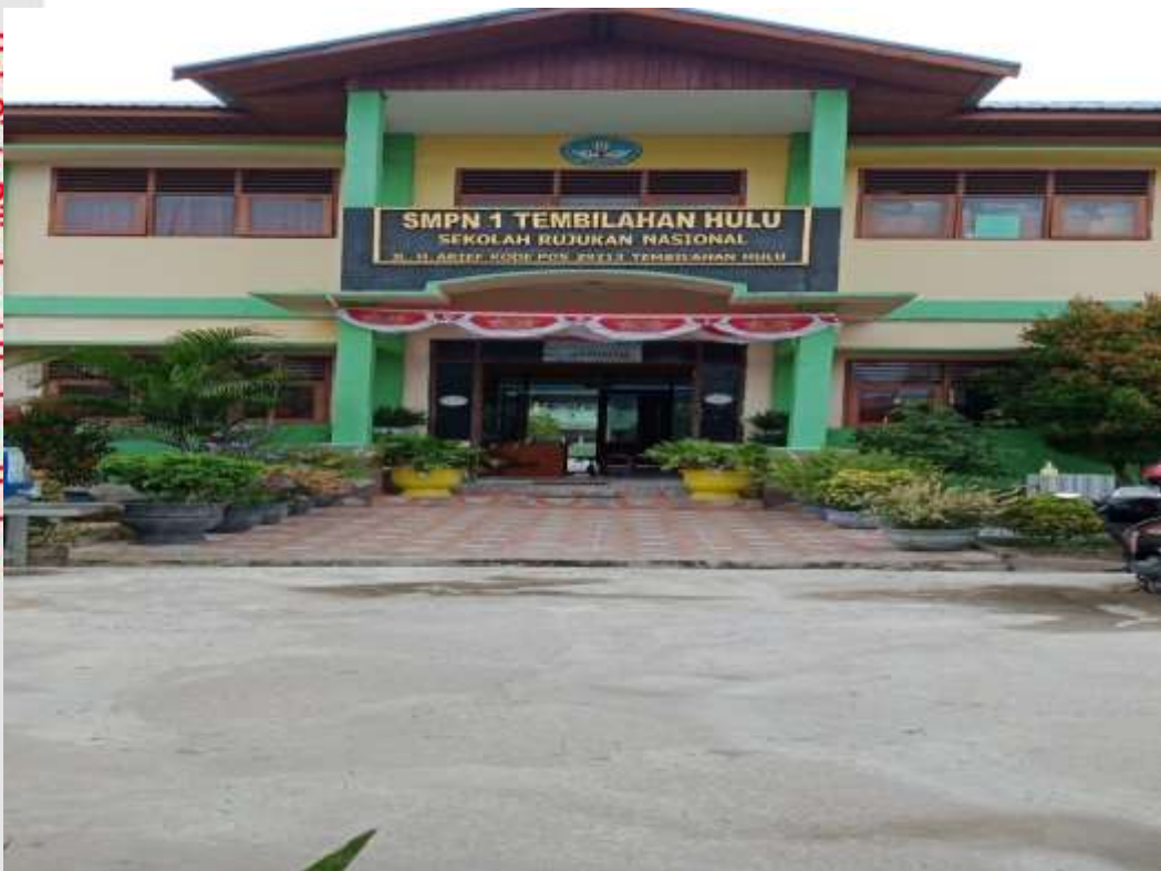
Gerbang SMP Negeri 1 Tembilaan Hulu