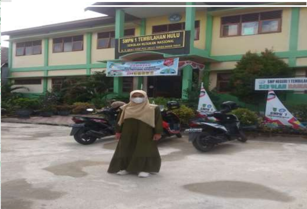
Peneliti sedang berada di SMP Negeri 1 Tembilaan Hulu