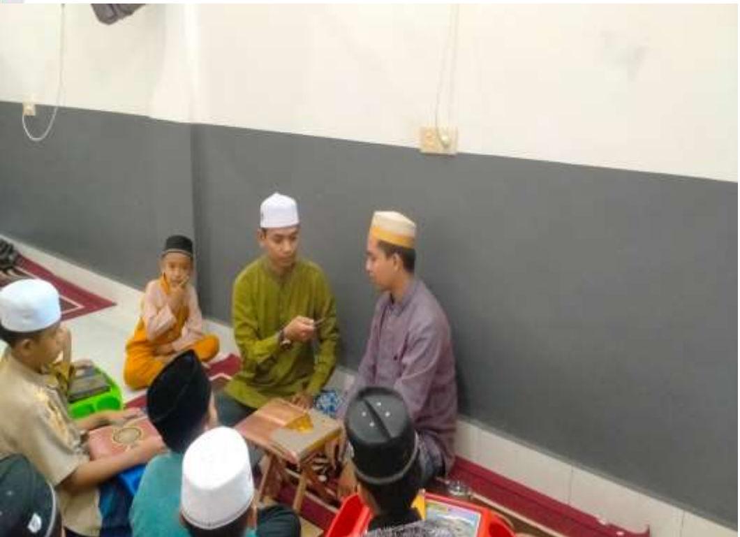
KEGIATAN MENANAMKAN KARAKTER DENGAN CARA MEMBERI NASIHAT