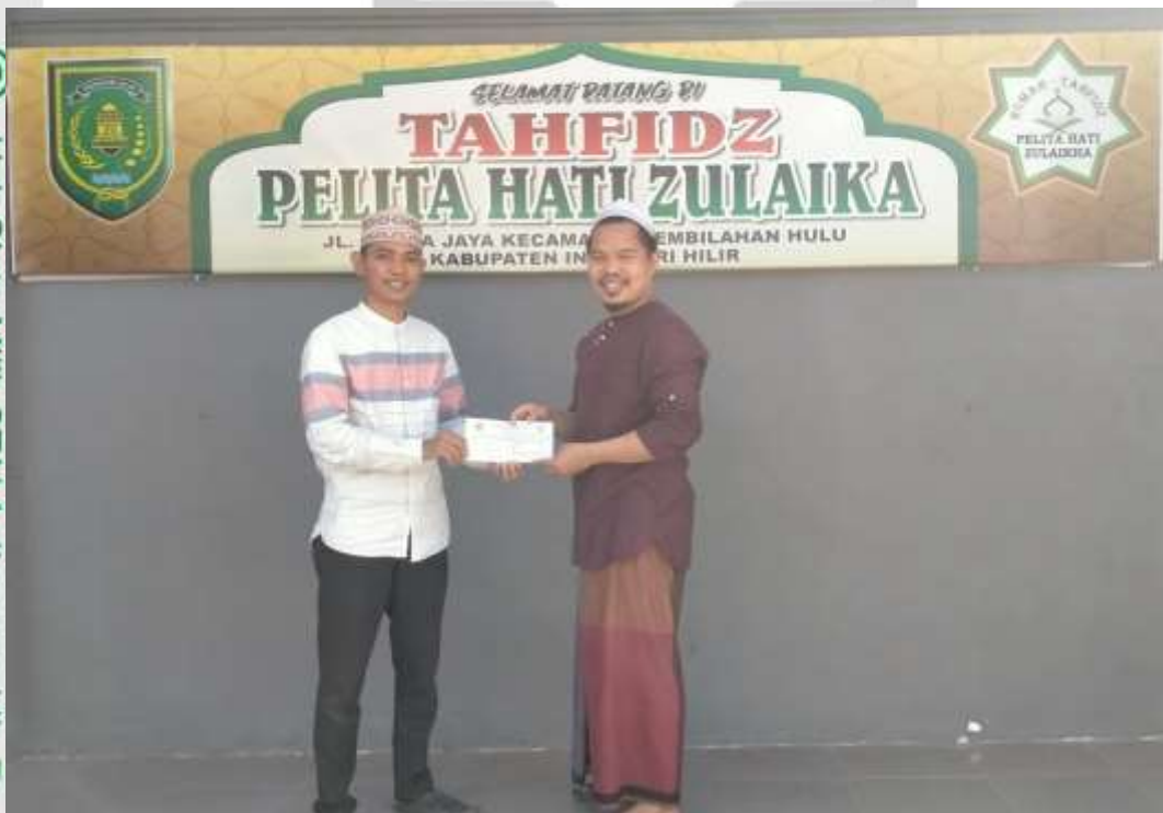
PENELITI MENYERAHKAN SURAT RISET KEPADA PIMPINAN YAYASAN

Hak Cipta Milik STAI Auliaurasyidin Tembilaan