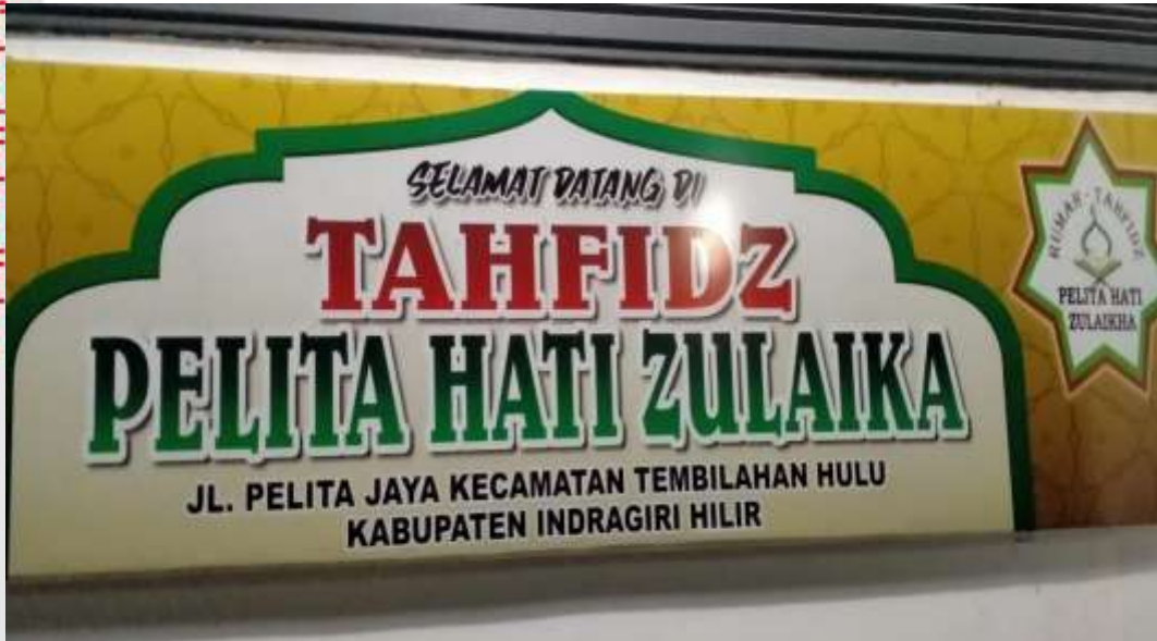
PAPAN NAMA RUMAH TAHFIDZ PELITA HATI ZULAIKHA JALAN PELITA JAYA KECAMATAN TEMBILAHAN HULU

Hak Cipta Milik STAI Auliaurasyidin Tembilaan