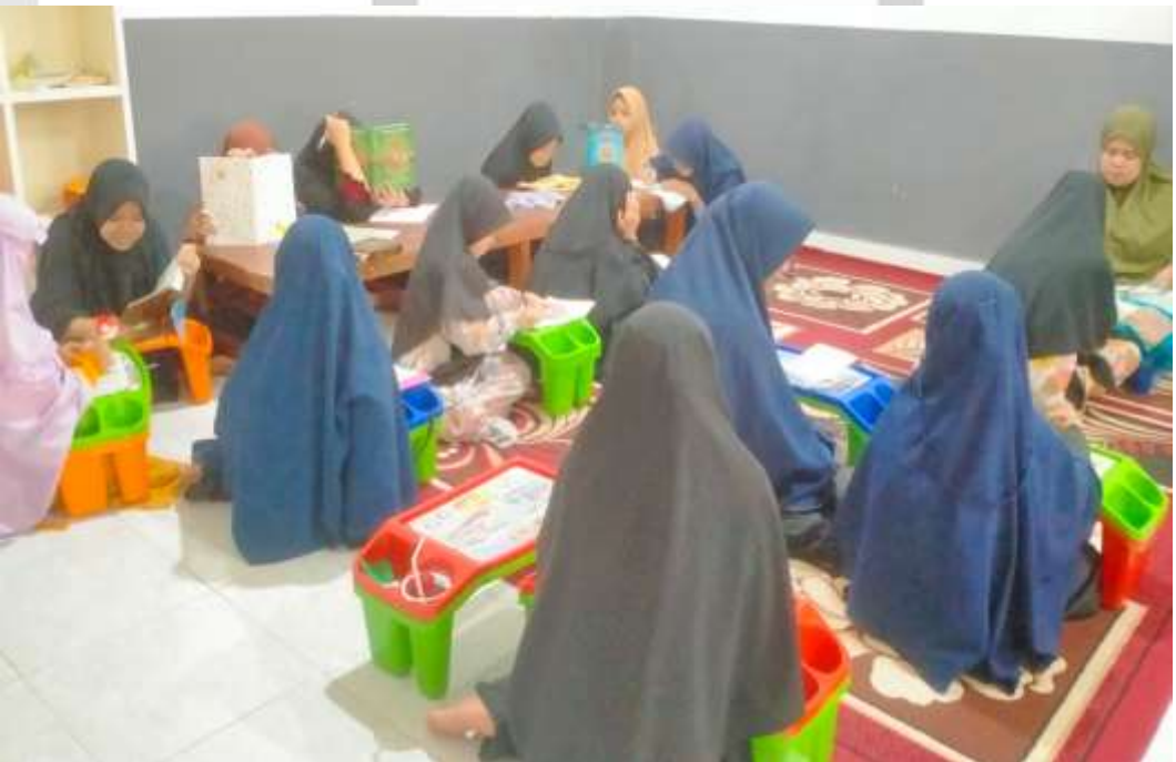
KEGIATAN MENANAMKAN NILAI-NILAI KARAKTER DENGAN CARA MEMBIASAKAN SANTRI MELAKSANAKAN TUGAS DENGAN PENUH TANGGUNGJAWAB