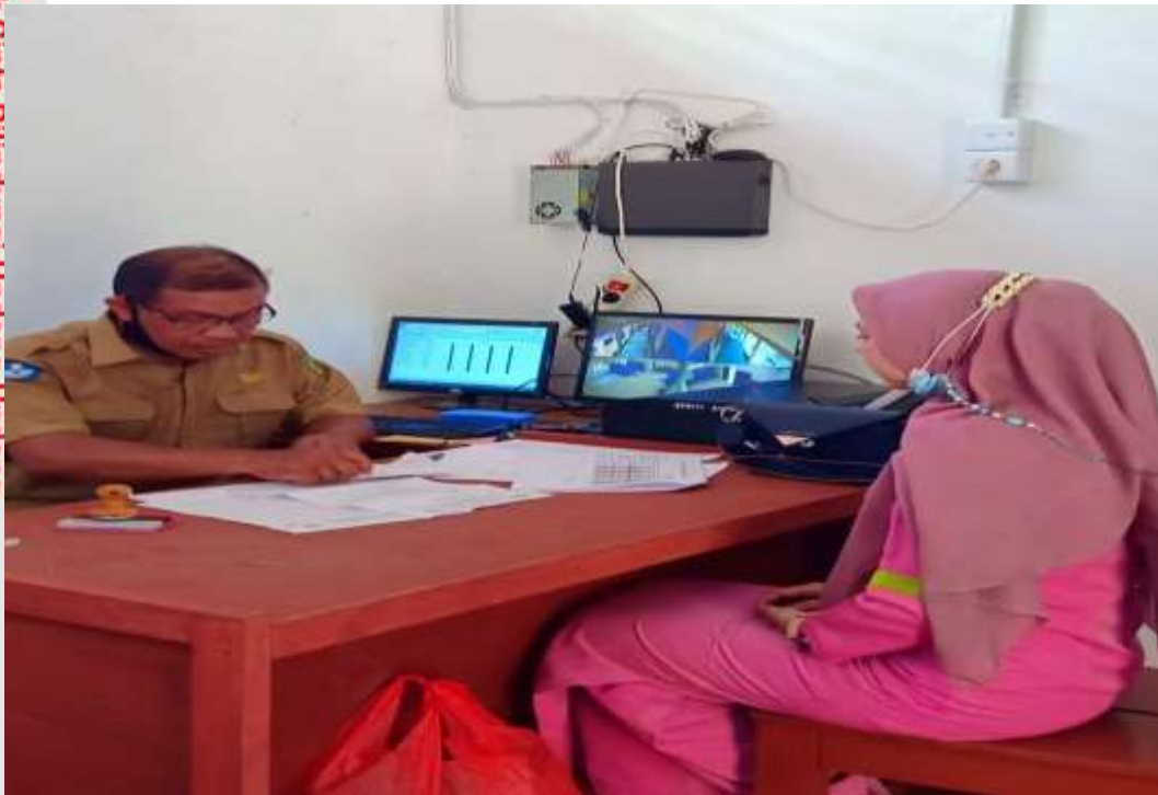
Penyerahan surat izin penelitian