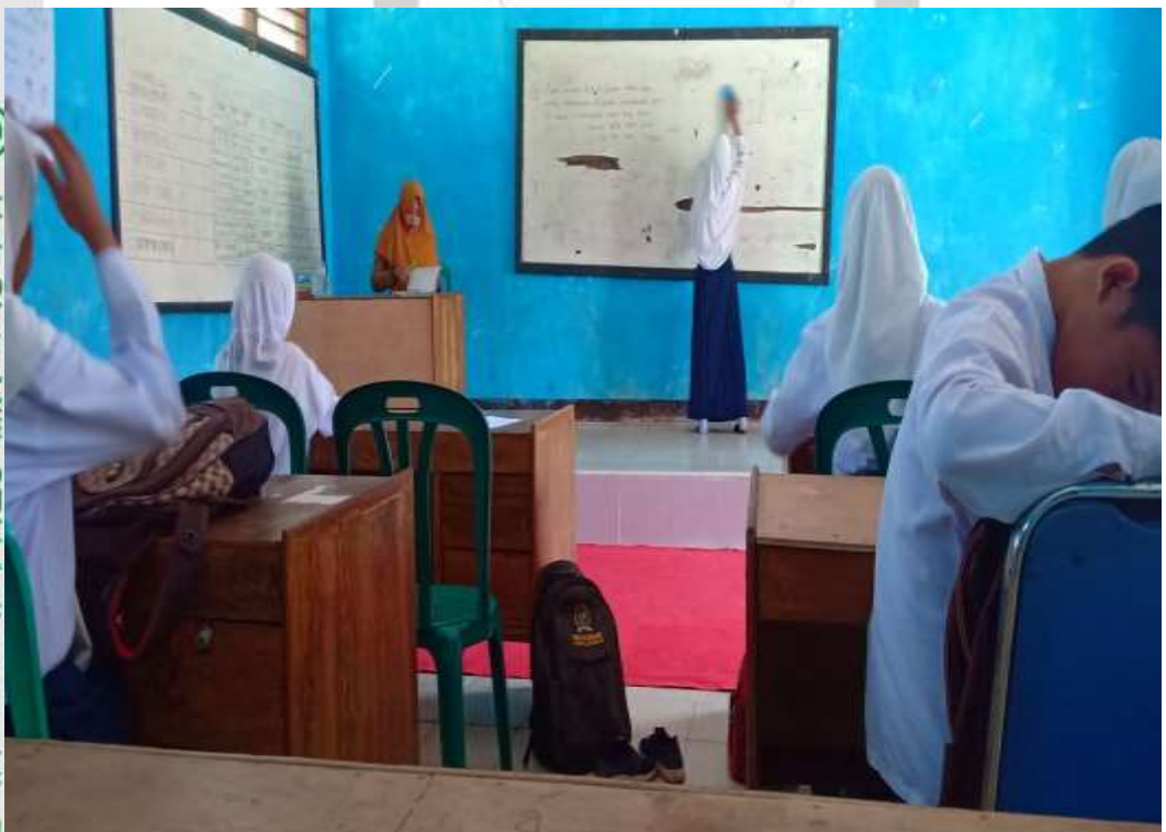
Observasi ke 2 peneliti di kelas IX

© Hak Cipta Milik STAI Auliaurrahyidin Tembilahan