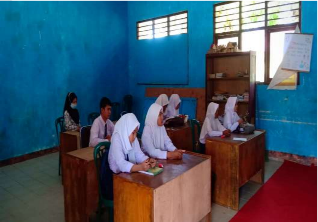
Observasi Pertama peneliti di kelas IX