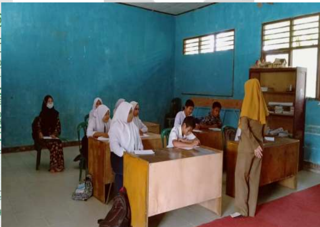
Observasi pertama peneliti dikelas VIII