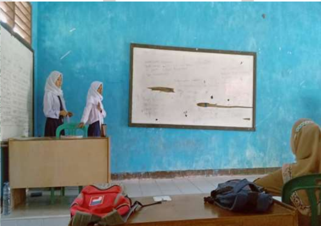
Perwakilan siswa menyampaikan hasil kerja