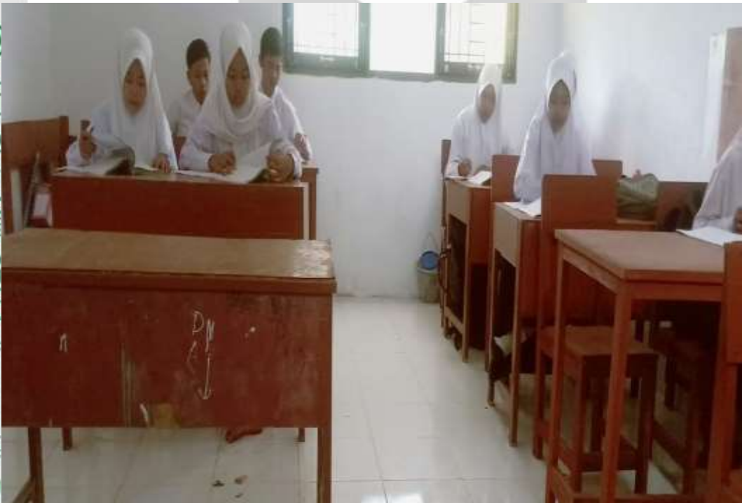
Observasi ketiga peneliti di kelas VIII

Hak Cipta Milik STAI Auliaurrasyidin Tembilahan