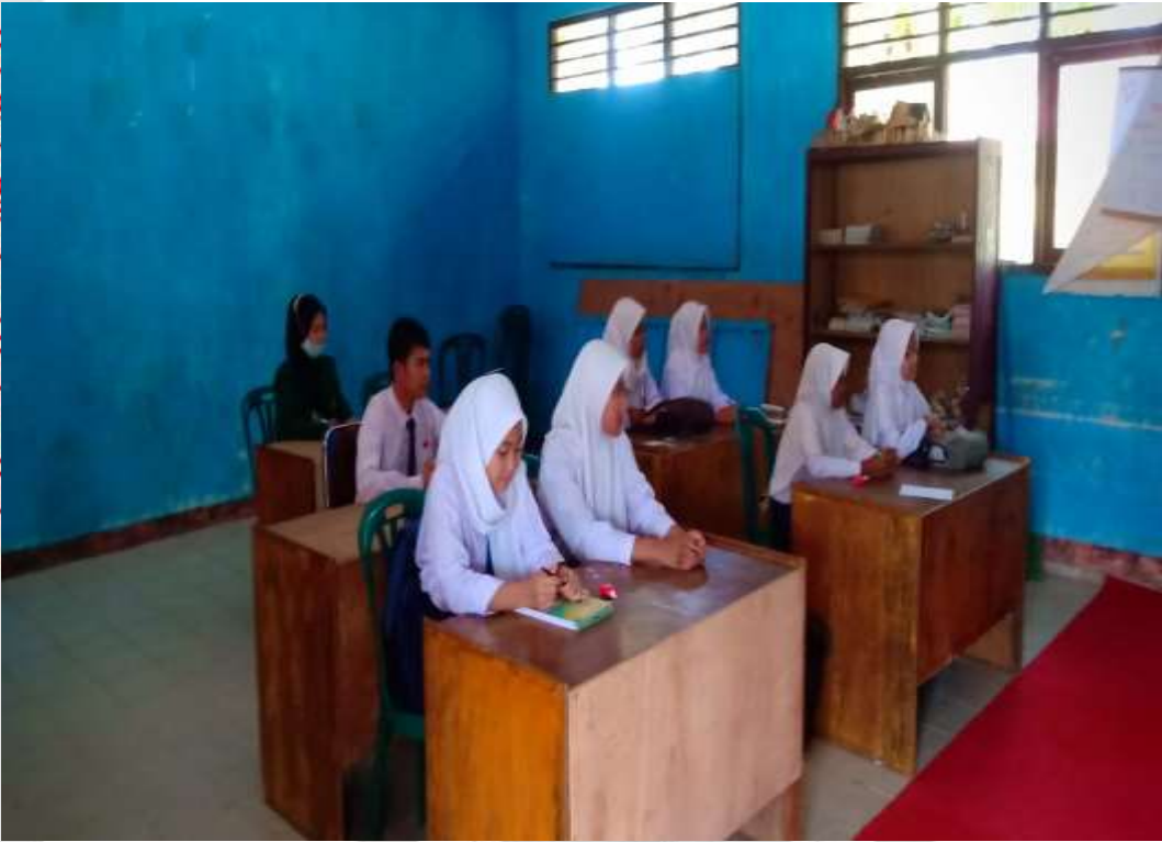
Observasi ke 3 peneliti di kelas IX