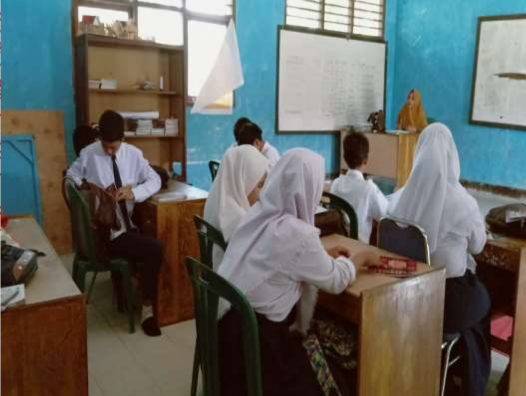
Observasi kedua peneliti di kelas VIII