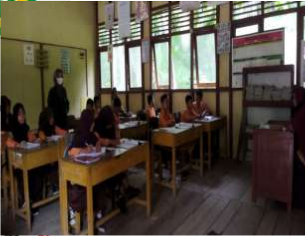
Penulis sedang mengamati Guru PAI di SDN 007 Pusaran