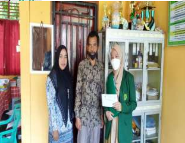
Penulis sedang sedang bersama Kepala Sekolah dan Guru PAI SDN 007 Pusaran