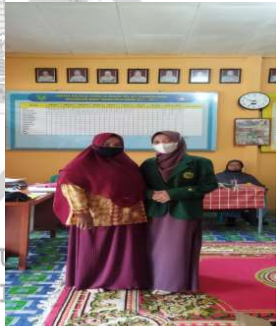
Penulis sedang bersama Guru PAI SDN 007 Pusaran