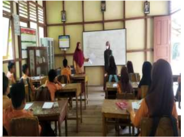
Penulis sedang mengamati Guru PAI di SDN 007 Pusaran