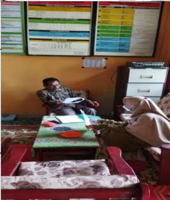
Penulis sedang bersama Kepala Sekolah SDN 007 Pusaran