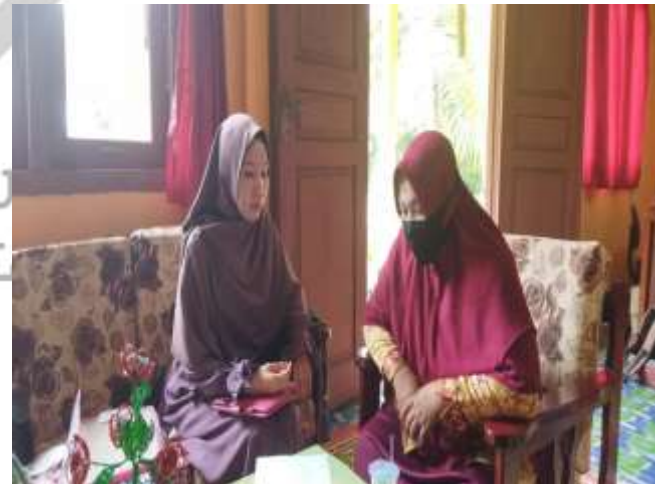
Penulis sedang mewawancari Guru Mata Pelajaran PAI