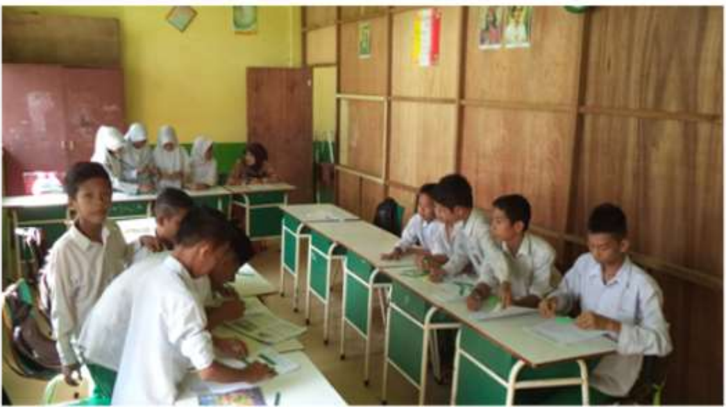
SISWA BEKERJA DALAM KELOMPOKNYA MASING-MASING