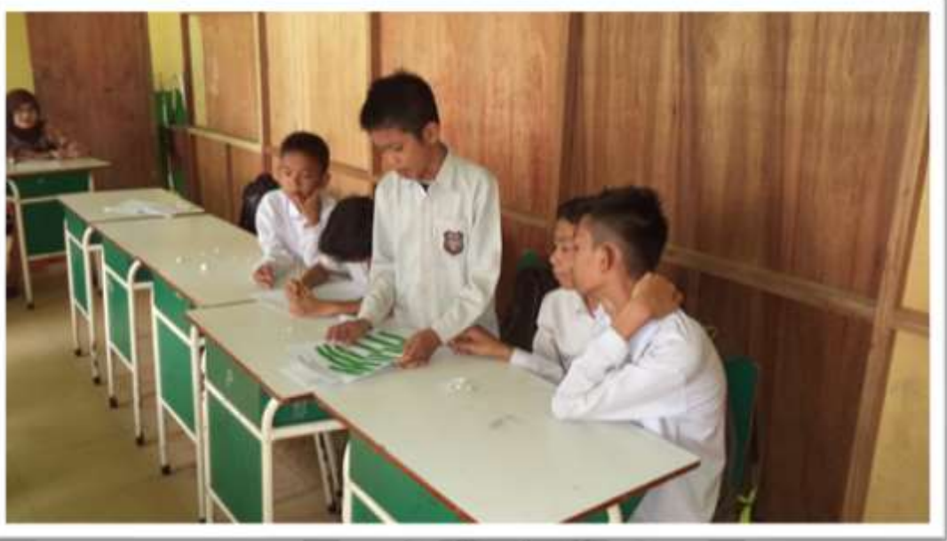
SISWA MENYAMPAIKAN HASIL KERJANYA