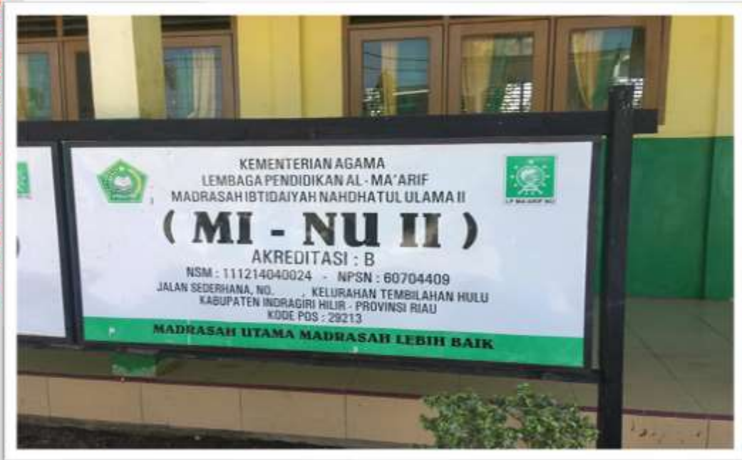
MADRASAH IBTIDAIYAH NAHDHATUL ULAMA II KECAMATAN TEMBILAHAN HULU