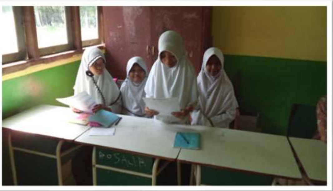
SISWA MENYAMPAIKAN HASIL KERJANYA

tan Opa tmmk STAI Auliaurrasyidin Tembilahan