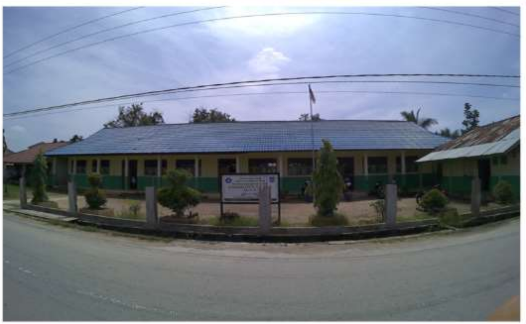
GEDUNG MADRASAH IBTIDAIYAH NAHDHATUL ULAMA II KECAMATAN TEMBILAHAN HULU