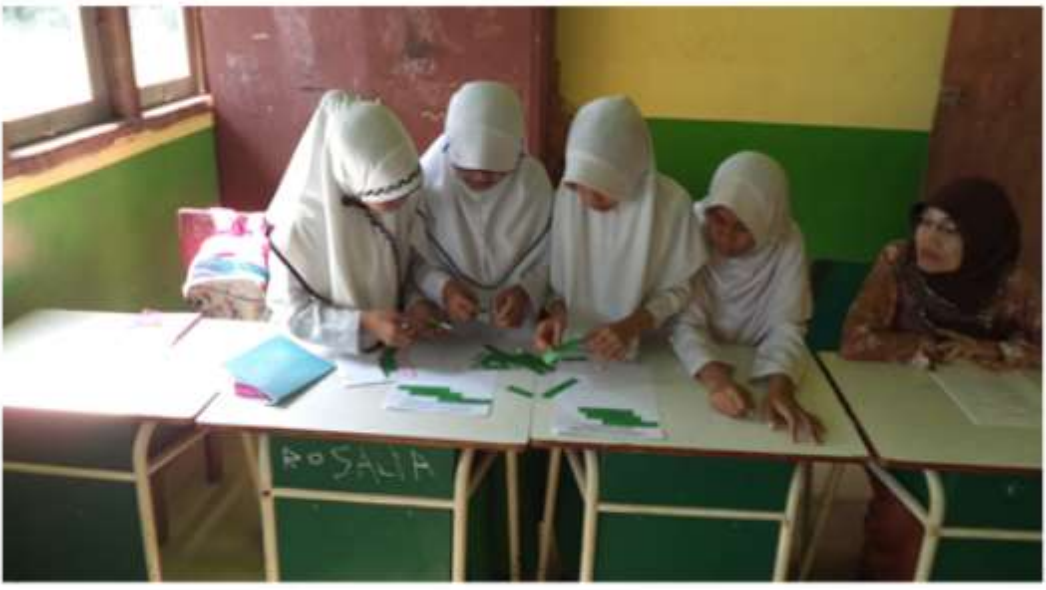
SISWA BEKERJA DALAM KELOMPOKNYA OBSERVER MENGAMATI PEKERJAAN SISWA