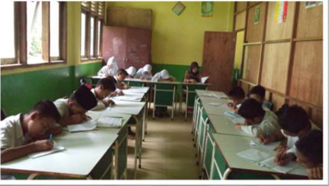
SISWA SEDANG MENERJAKAN TUGAS