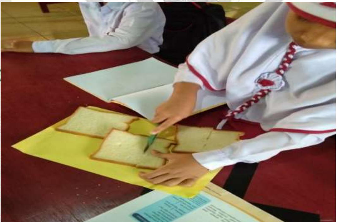
SISWA MELAKSANAKAN KEGIATAN PEMBELAJARAN RME