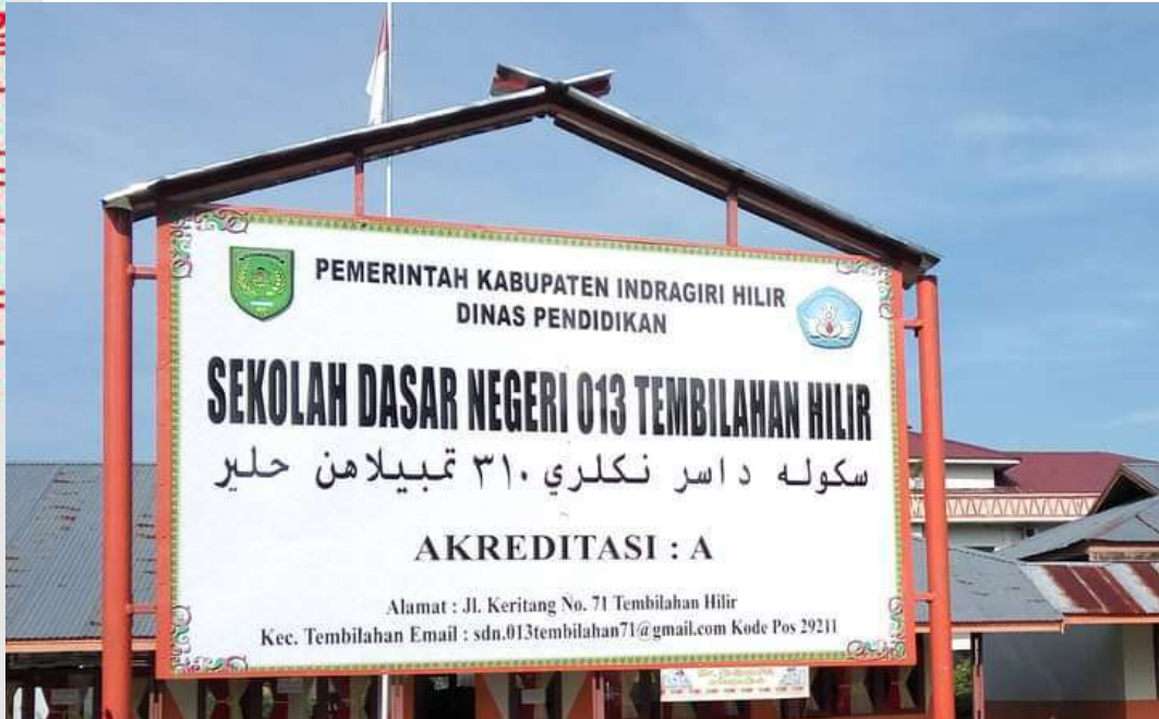
PAPAN NAMA SEKOLAH DASAR NEGERI 013 TEMBILAHAN HILIR