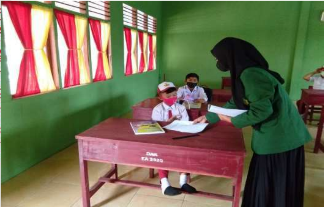
PENELITI SEDANG MENYERAHKAN SOAL TES