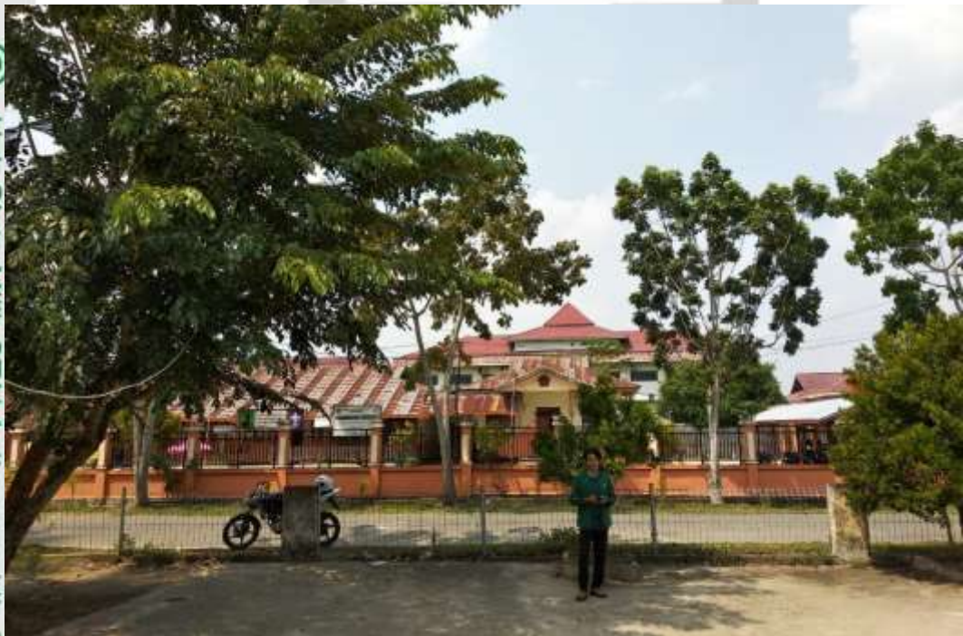
GEDUNG SEKOLAH DASAR NEGERI 013 TEMBILAHAN HILIR