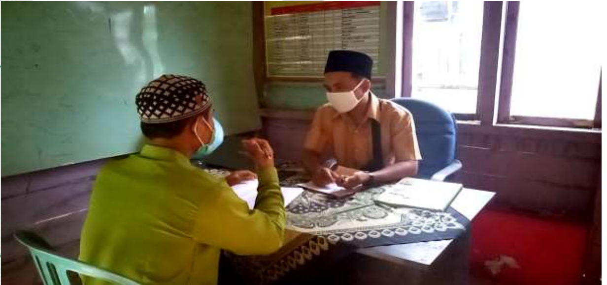
Gambar wawancara guru bahasa arab di Madrasah Aliyah Sungai Nibung Kecamatan Tembilahan Hulu.