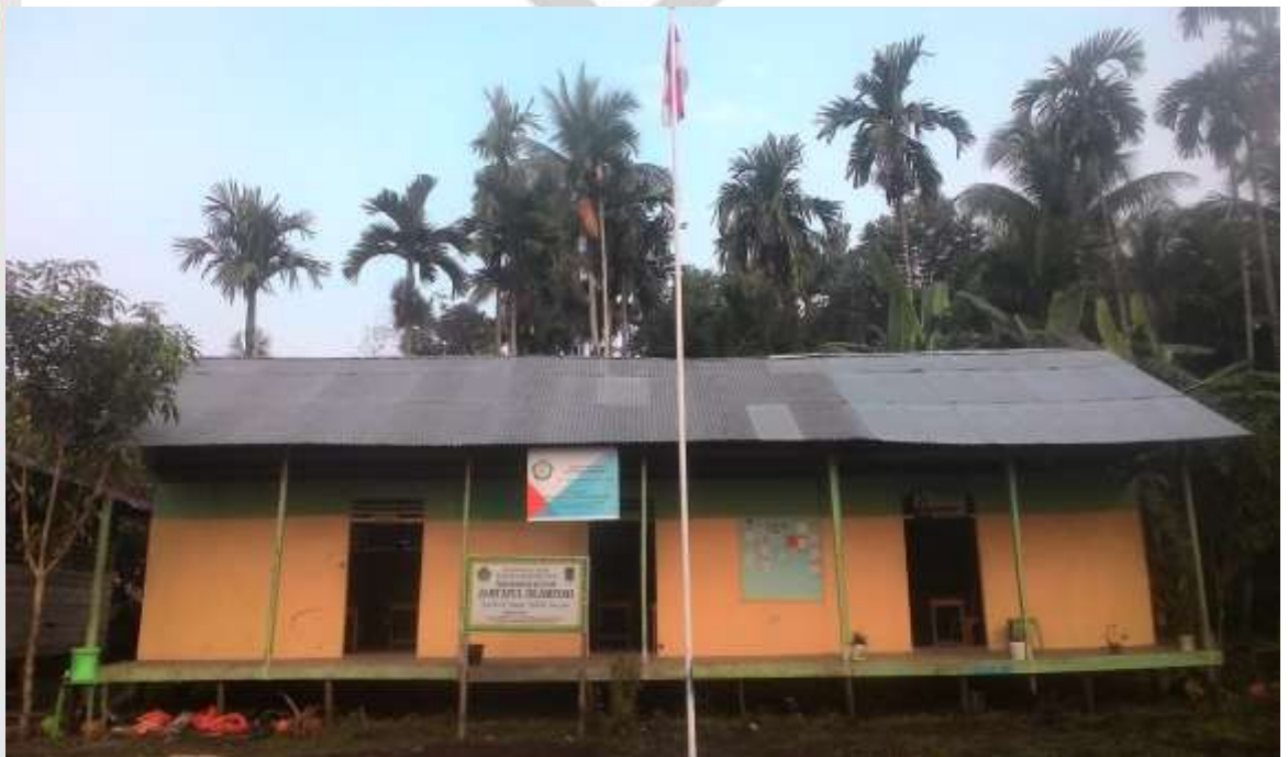
Gambar Madrasah Jami`Atul Islamiyah Sungai Nibung Kecamatan Tembilahan Hulu.