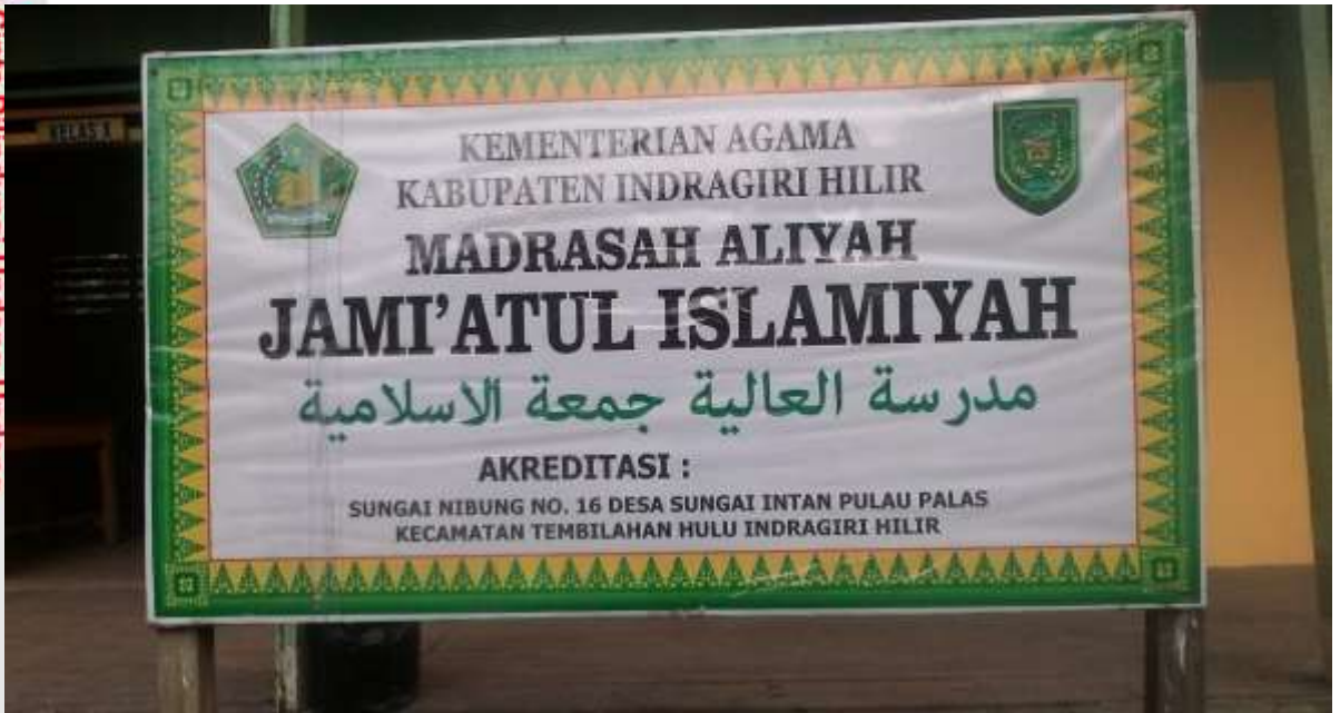
Gambar Plang nama Madrasah Aliyah Jami`Atul Islamiyah Sungai Nibung Kecamatan Tembilahan Hulu.