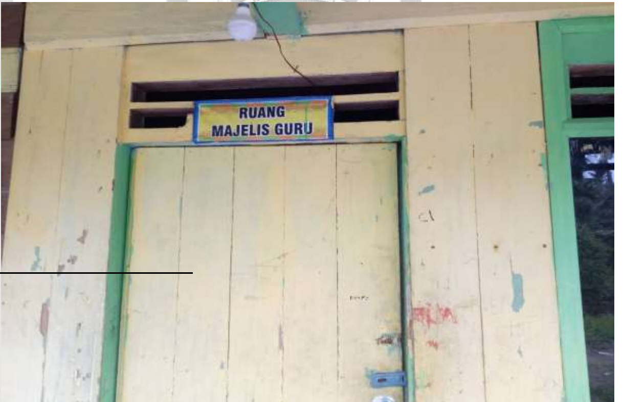
Gambar ruang Majlis Guru Madrasah Aliyah Jami`Atul Islamiyah Sungai Nibung Kecamatan Tembilahan Hulu.