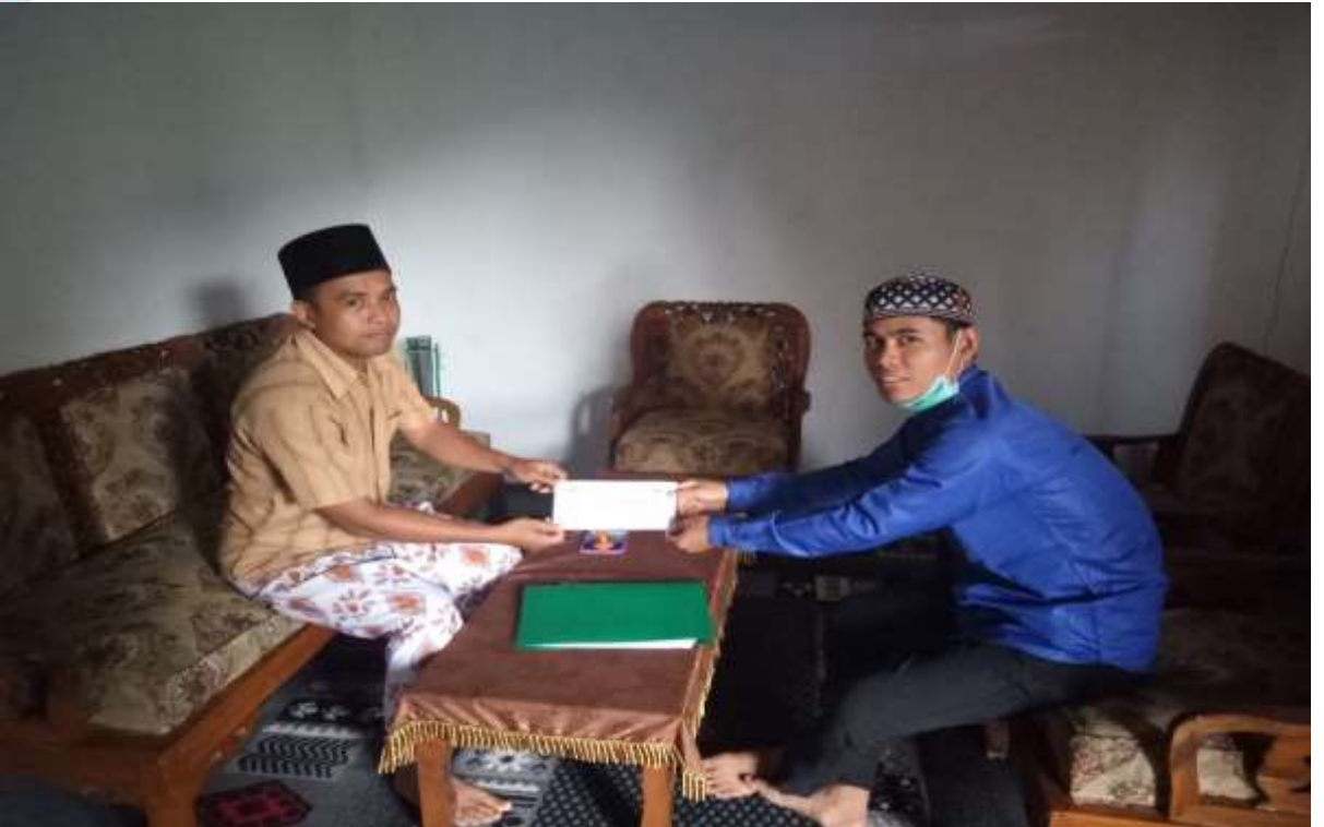
Gambar penyerahan surat riset Kepada Kepala Madrasah