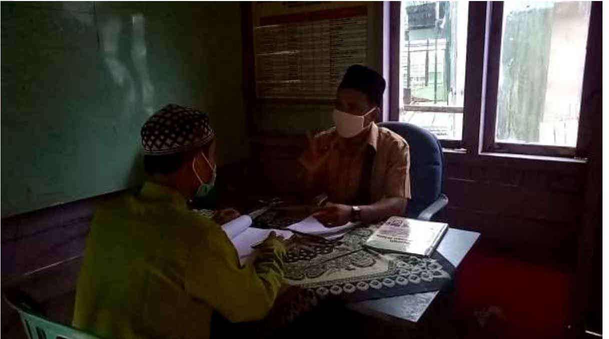
Gambar wawancara guru bahasa arab di Madrasah Aliyah Sungai Nibung Kecamatan Tembilahan Hulu.