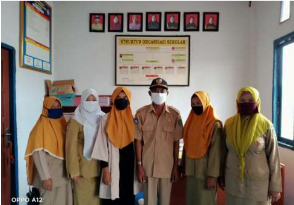
Poto Bersama Bapak Kepsek dan Ibu-ibu Guru SDN 027 Simpang Gaung Kec. Gaung