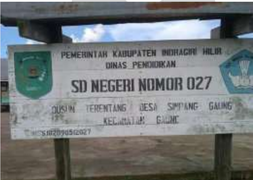
Plang Sekolah SDN 027 Simpang Gaung