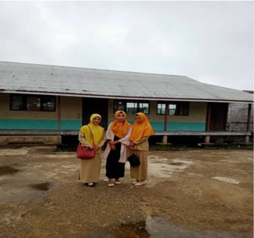
Poto bersama wali kelas VI dan V