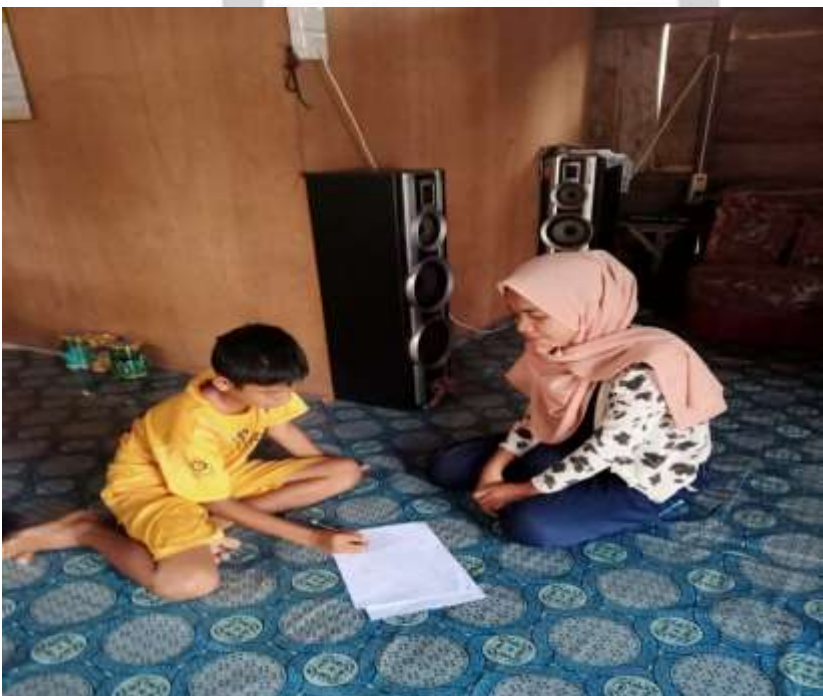
Mendampingi anak2 dalam pengisian angket