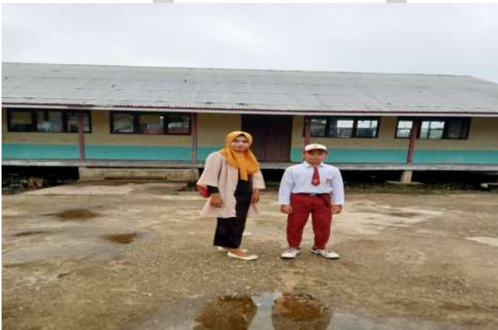
Poto bersama salah satu Siswa kelas V