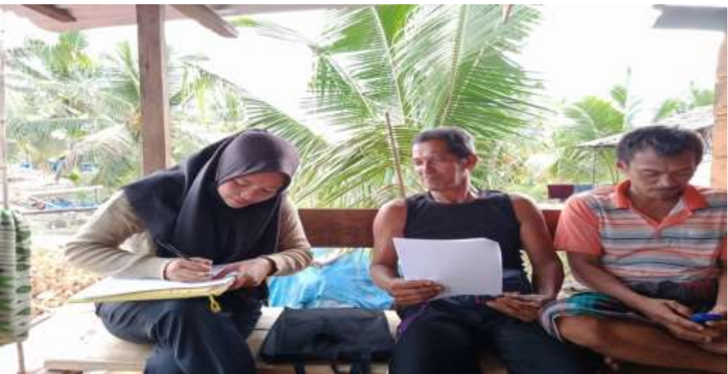
FOTO DOKUMENTASI PENYEBARAN ANGKET DI PARIT 11 DUSUN II DESA SUNGAI SIMBAR KECAMATAN KATEMAN KABUPATEN INDRAGIRI HILIR