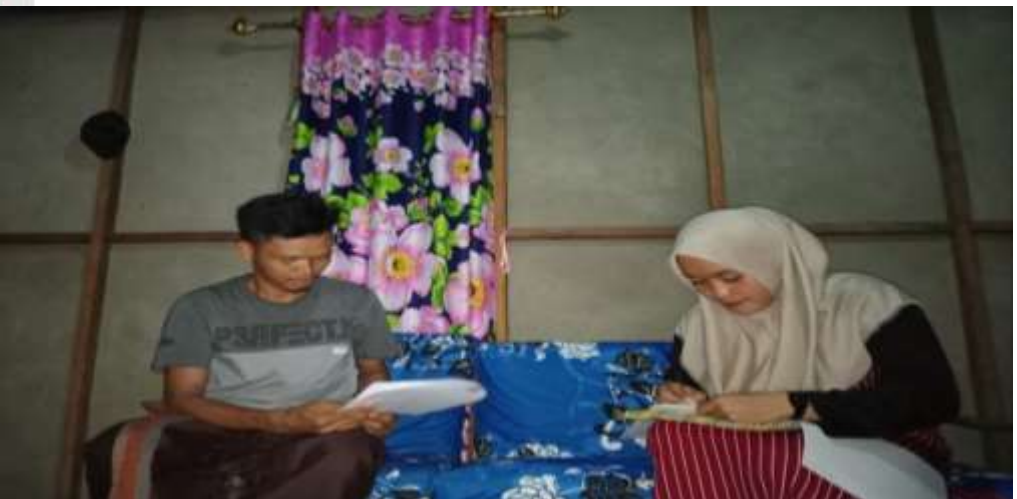
FOTO DOKUMENTASI PENYEBARAN ANGKET DI PARIT 4 DUSUN I DESA SUNGAI SIMBAR KECAMATAN KATEMAN KABUPATEN INDRAGIRI HILI