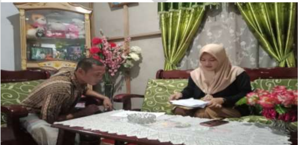
FOTO DOKUMENTASI PENYEBARAN ANGKET DI PARIT 9 & 10 DUSUN II DESA SUNGAI SIMBAR KECAMATAN KATEMAN KABUPATEN INDRAGIRI HILIR