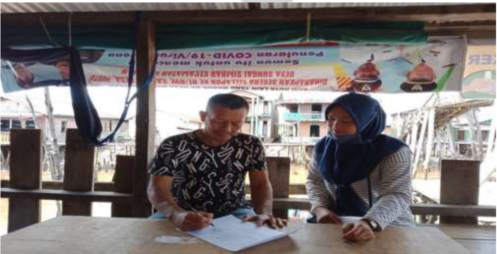
PENGAMBILAN SURAT BALASAN RISET DI RUMAH KEPALA DESA SUNGAI SIMBAR KECAMATAN KATEMAN KABUPATEN INDRAGIRI HILIR