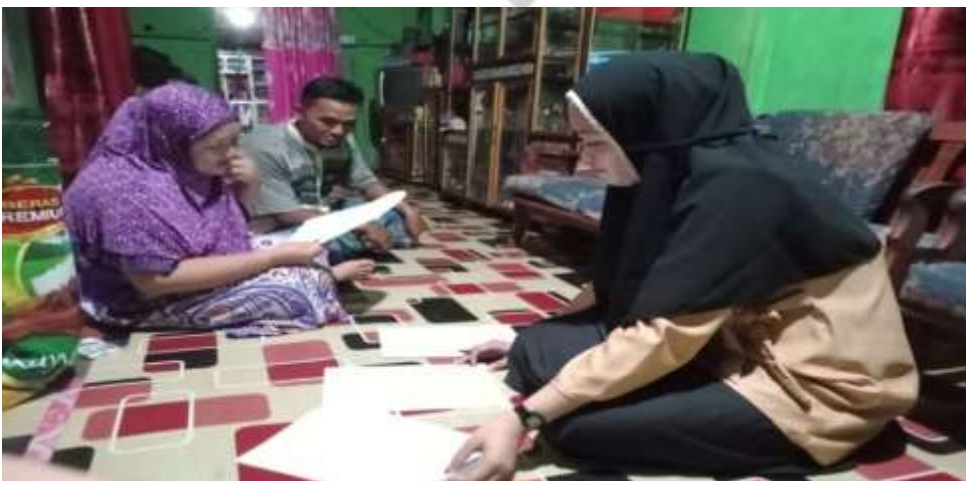
FOTO DOKUMENTASI PENYEBARAN ANGKET DI PARIT 8 DUSUN II DESA SUNGAI SIMBAR KECAMATAN KATEMAN KABUPATEN INDRAGIRI HILIR