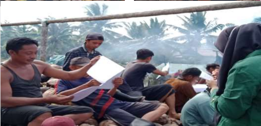
FOTO DOKUMENTASI PENYEBARAN ANGKET DI PARIT 12 DUSUN II DESA SUNGAI SIMBAR KECAMATAN KATEMAN KABUPATEN INDRAGIRI HILIR