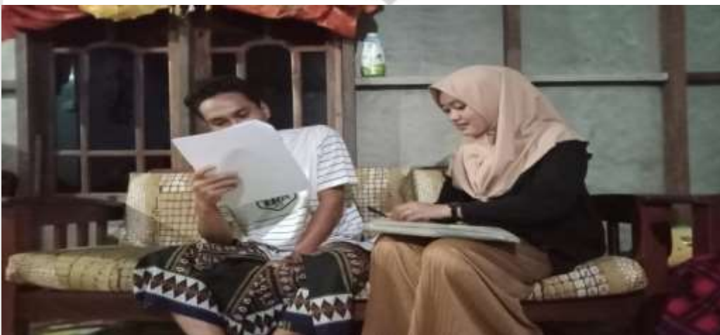
FOTO DOKUMENTASI PENYEBARAN ANGKET DI PARIT 7 DUSUN II DESA SUNGAI SIMBAR KECAMATAN KATEMAN KABUPATEN INDRAGIRI HILIR