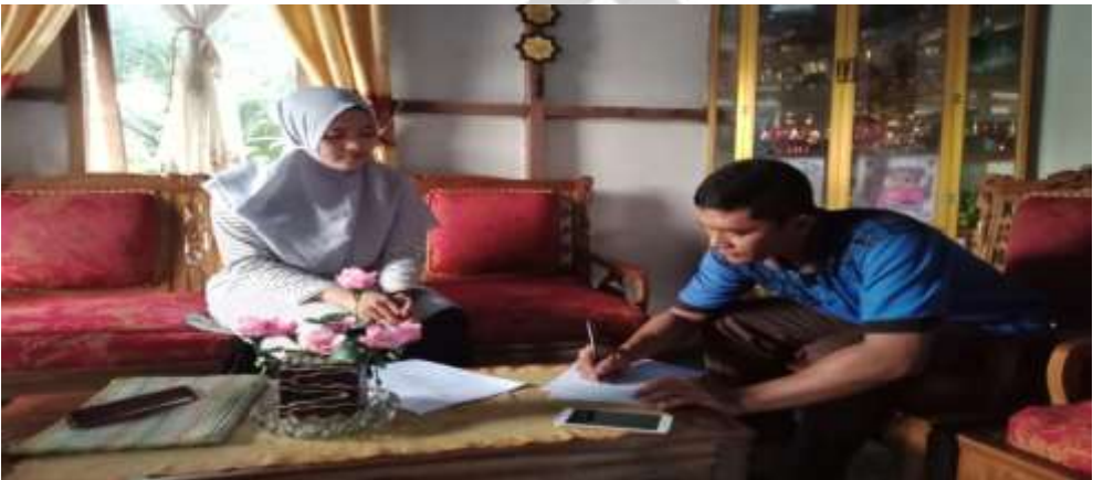
FOTO DOKUMENTASI PENYEBARAN ANGKET DI PARIT 3 DUSUN I DESA SUNGAI SIMBAR KECAMATAN KATEMAN KABUPATEN INDRAGIRI HILIR