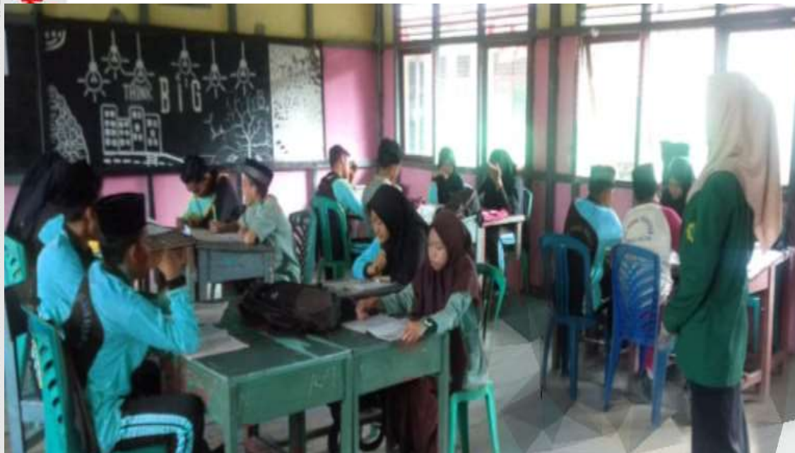
Peneliti menjelaskan serta menyebarkan Angket kepada Siswa-Siswi Di Sekolah Menengah Kejuruan Rasau Kuning Kecamatan Tempuling