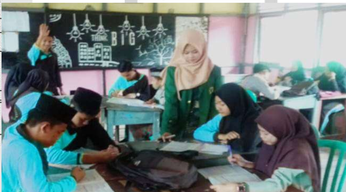
Peneliti menjelaskan serta menyebarkan Angket kepada Siswa-Siswi Di Sekolah Menengah Kejuruan Rasau Kuning Kecamatan Tempuling