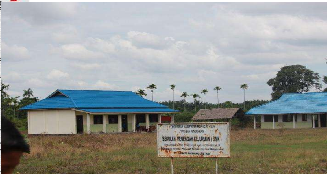
Photo Dokumentasi Bangunan & Plank Sekolah Menengah Kejuruan Rasau Kuning Kecamatan Tempuling