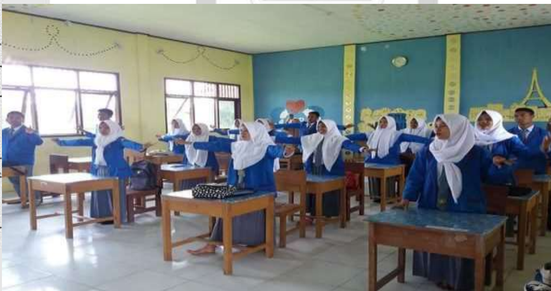
Peneliti mengamati kegiatan belajar siswa-siswi Di Kelas Di Sekolah Menengah Kejuruan Rasau Kuning Kecamatan Tempuling