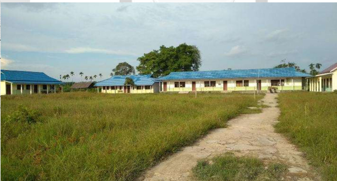
Photo Dokumentasi Bangunan Sekolah Menengah Kejuruan Rasau Kuning Kecamatan Tempuling