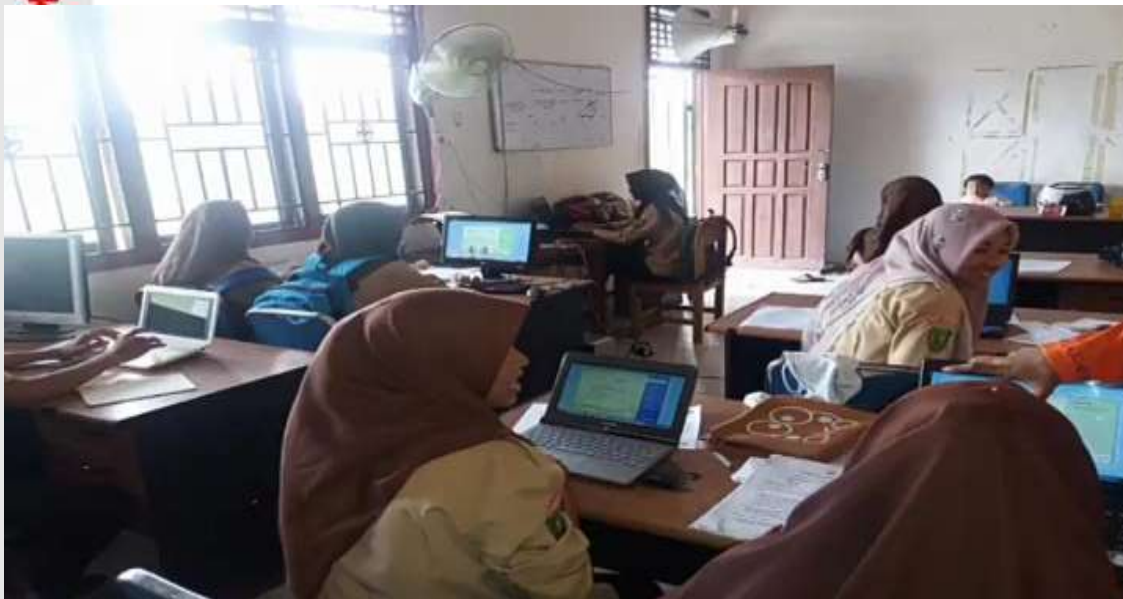
Peneliti mengamati kegiatan belajar siswa-siswi di Ruang Komputer Di Sekolah Menengah Kejuruan Rasau Kuning Kecamatan Tempuling